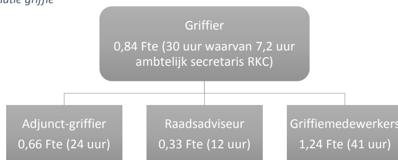
Figuur 1: Huidige formatie griffie

Indien de raad akkoord gaat met dit raadsvoorstel komt de formatie van de griffie op een totaal van 4,14 Fte (149 uur). De nieuwe samenstelling is weergegeven in onderstaande figuur 2. In deze samenstelling krijgt de raadsadviseur een structurele plek maar blijven de uren van de griffier en adjunct-griffier ook op peil. De inzet van een communicatieadviseur gespecialiseerd in raadscommunicatie ondersteunt de behoefte van de raad om meer in contact te staan en samen te werken met de samenleving. De communicatieadviseur wordt voor een periode van 6 maanden aangesteld waarna medio/eind 2019 de rol van de communicatieadviseur geëvalueerd wordt en bekeken wordt of structurele invulling wenselijk is.