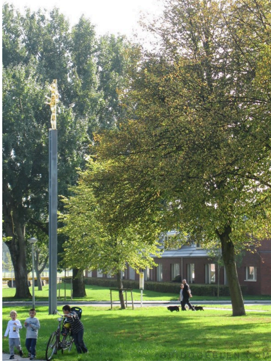
Sculptuur van Guido Geelen