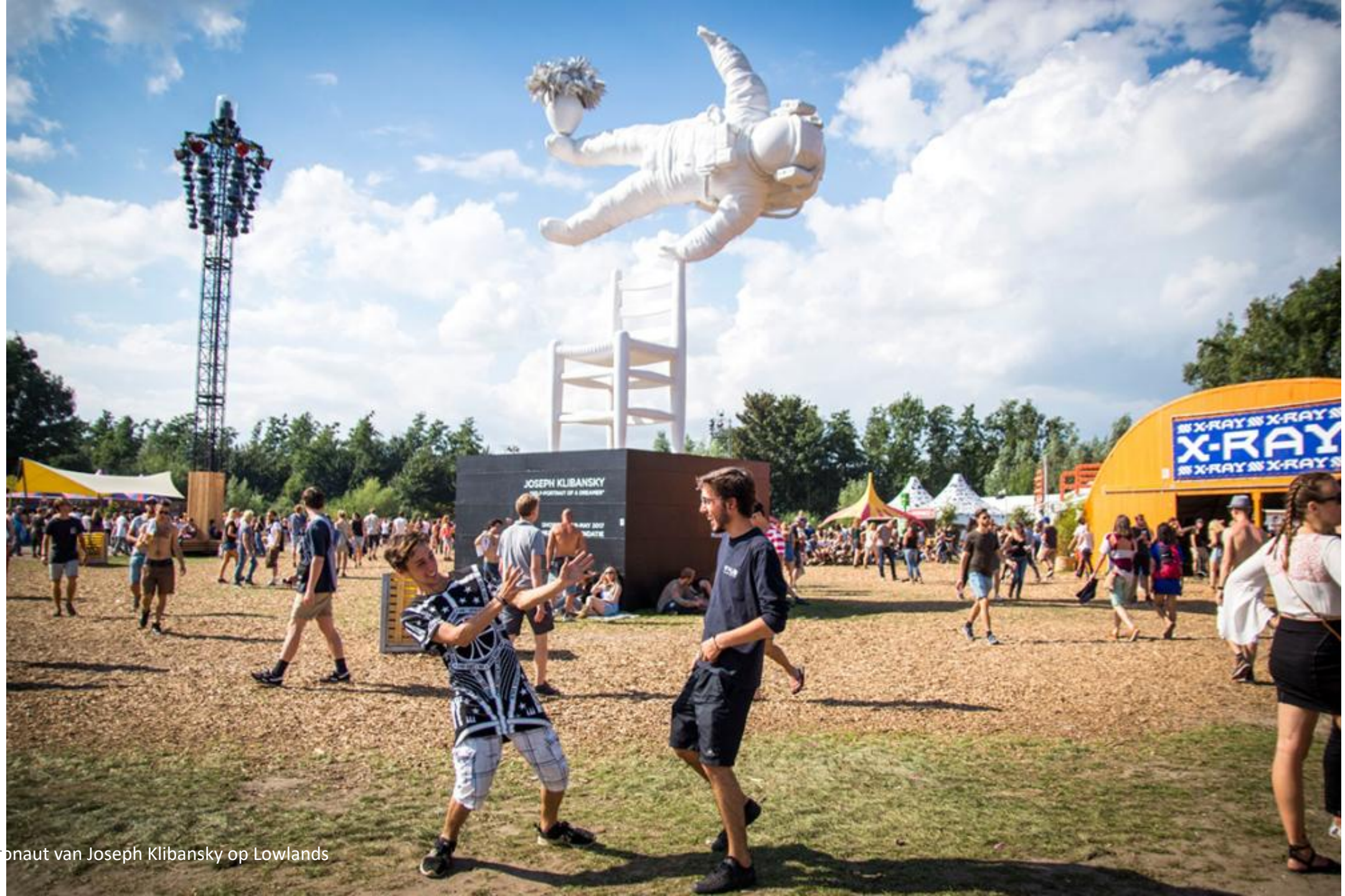
Astronaut van Joseph Klibansky op Lowlands