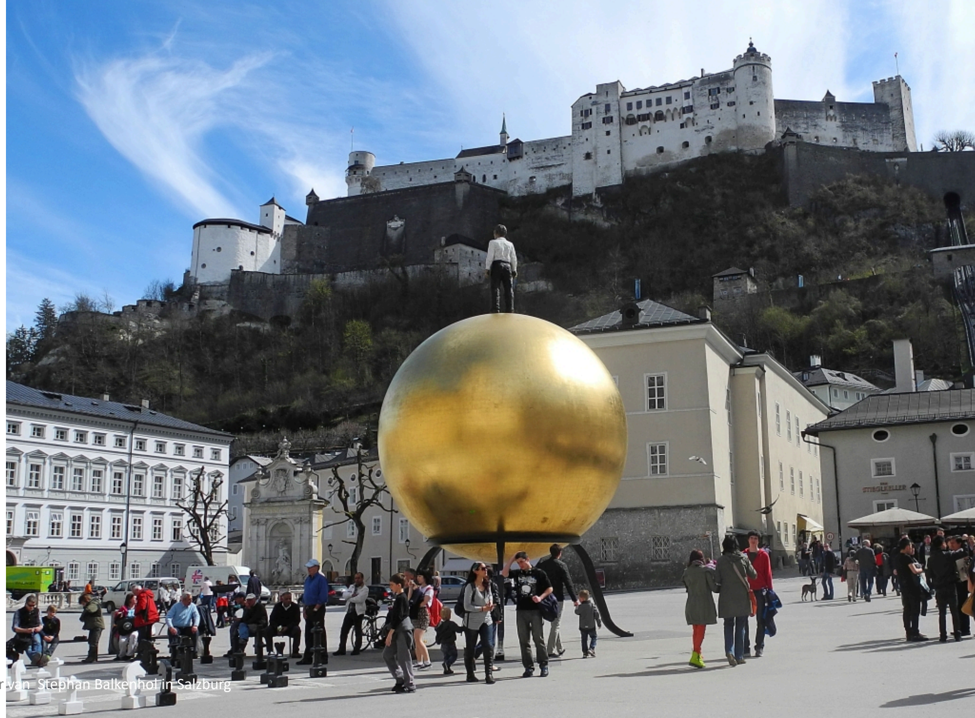
Sculptuur van Stephan Balkenhol in Salzburg