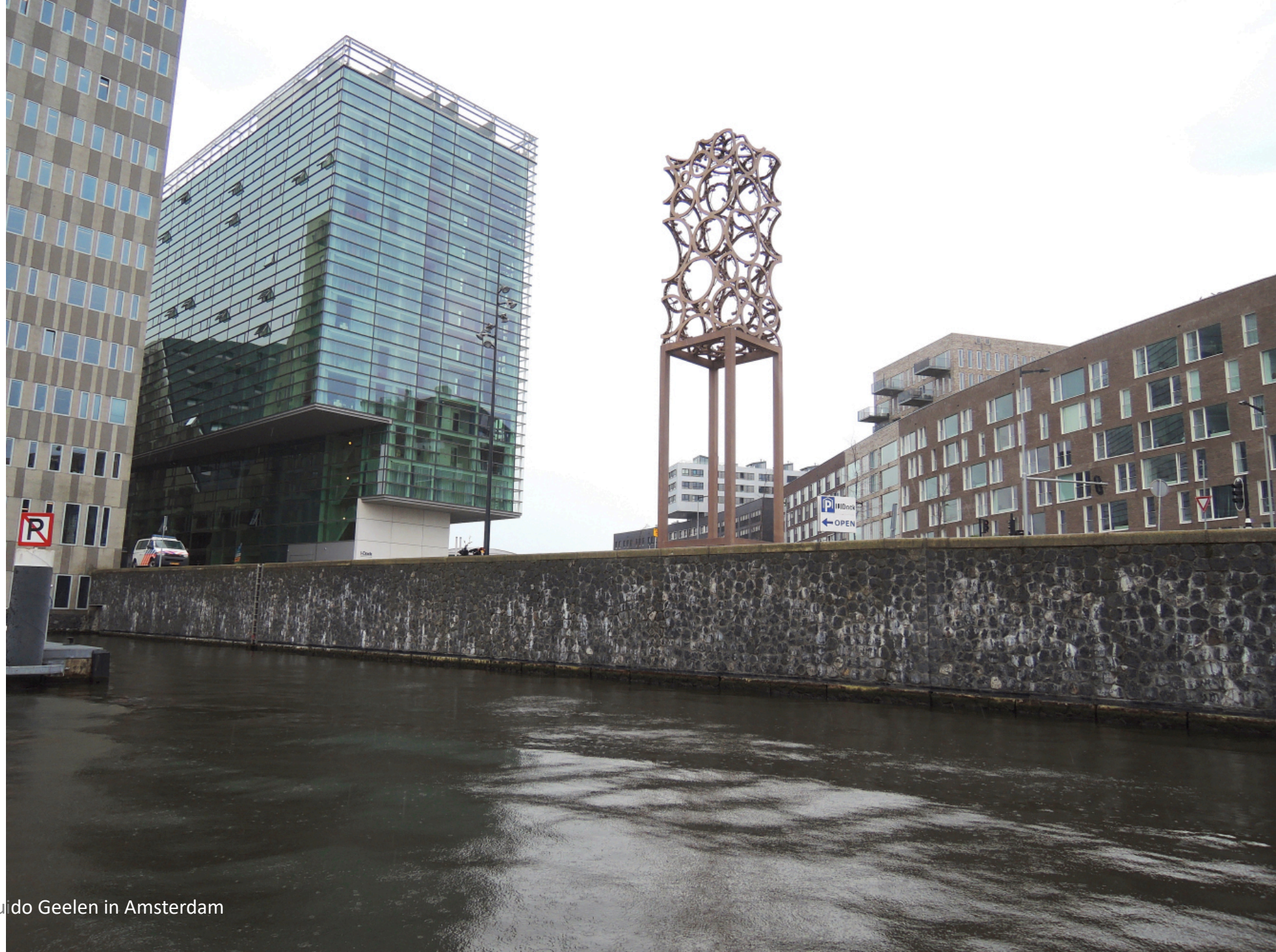
Beeld van Guido Geelen in Amsterdam