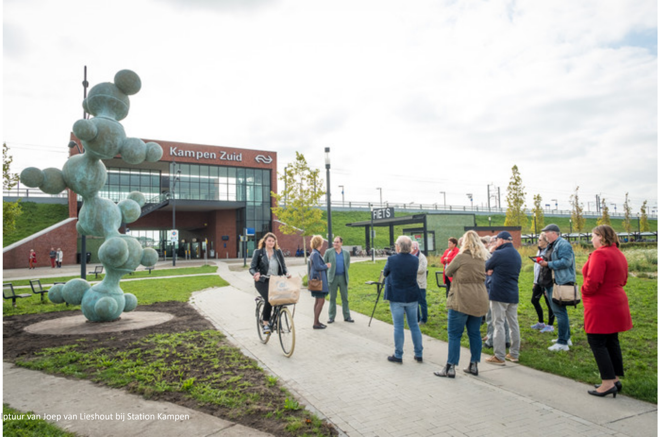
Sculptuur van Joep van Lieshout bij Station Kampen