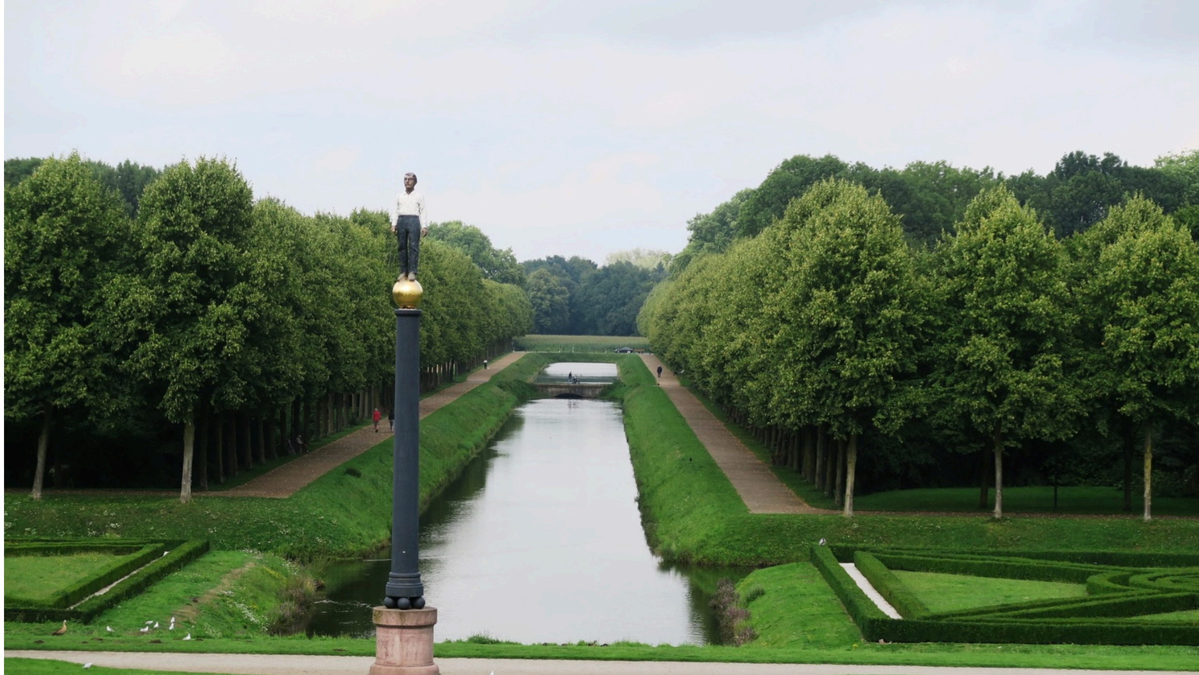
Sculptuur van Stephan Balkenhol in Kleve