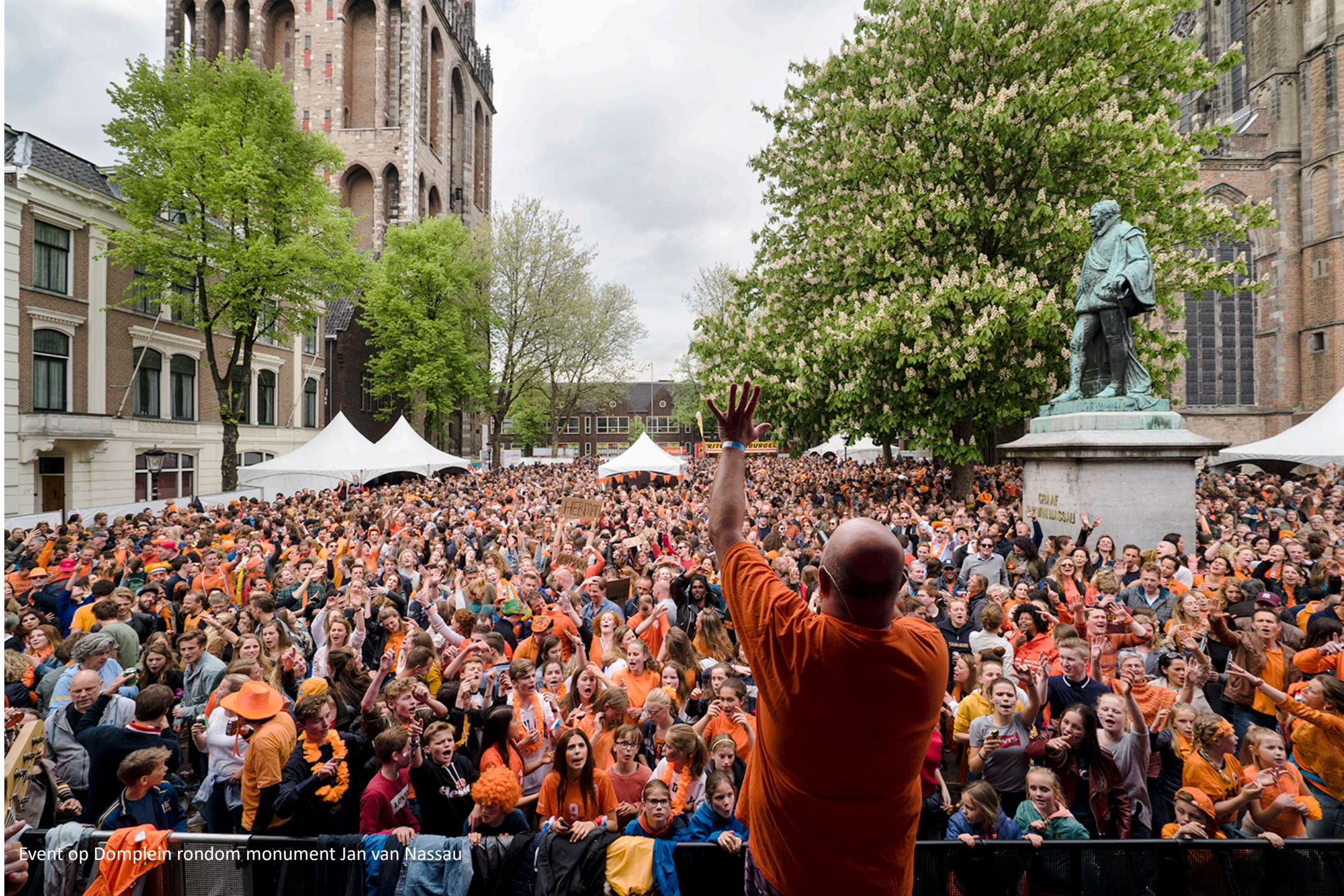
Event op Domplein rondom monument Jan van Nassau