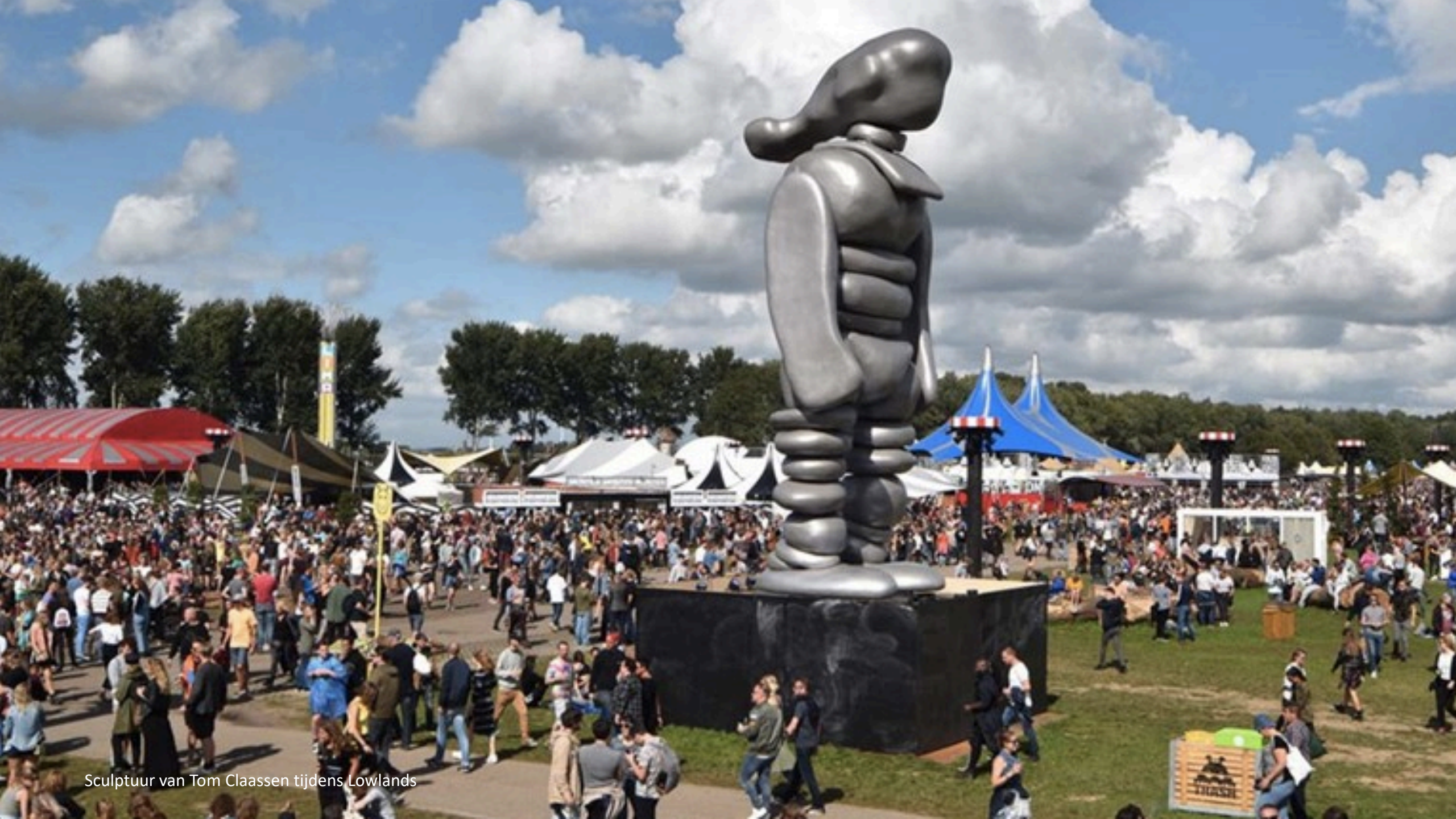
Sculptuur van Tom Claassen tijdens Lowlands