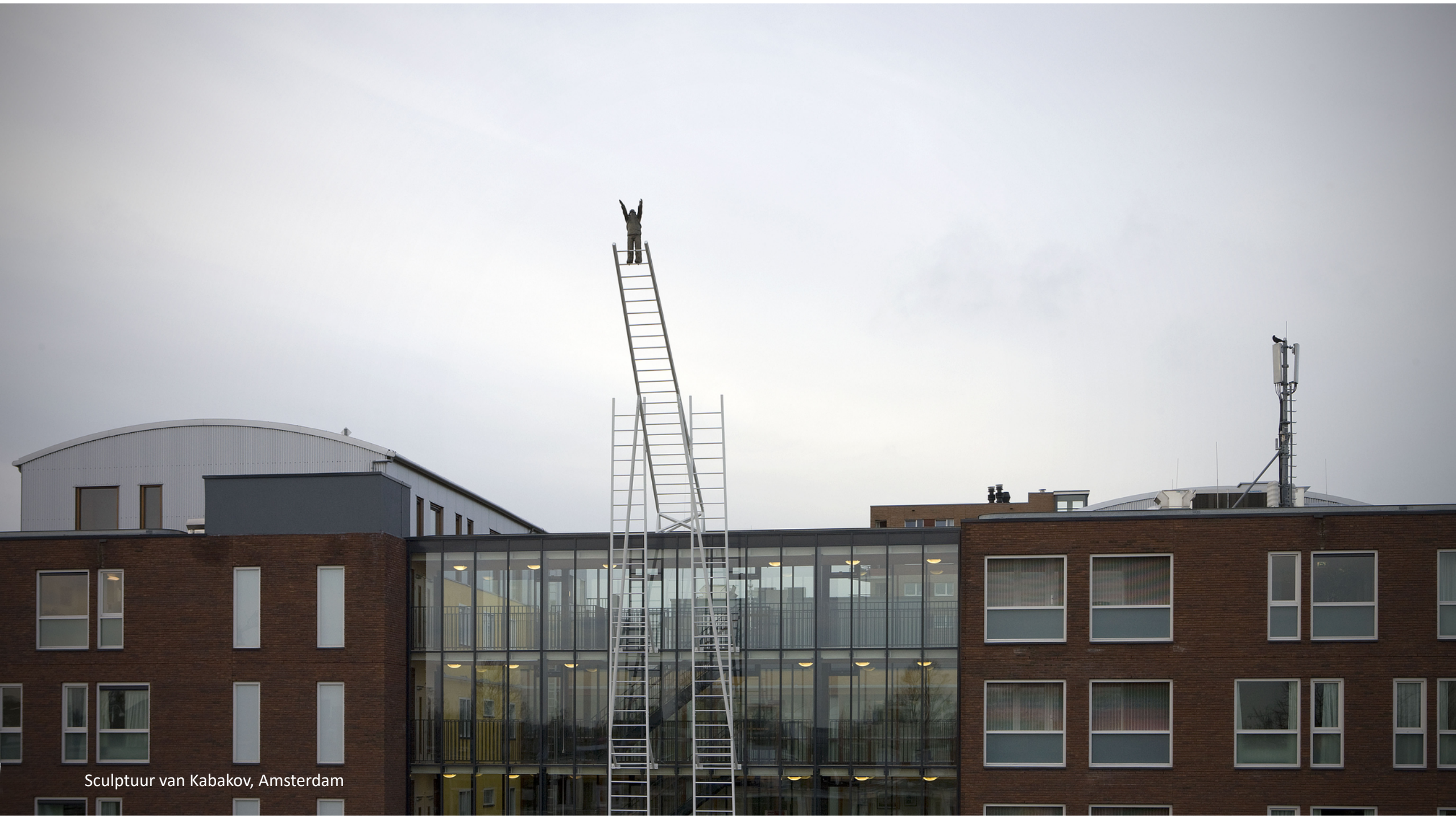
Sculptuur van Kabakov, Amsterdam