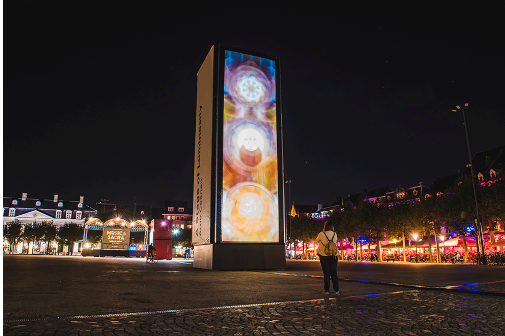
A stage of Luminosity, Arno Coenen, Maastricht