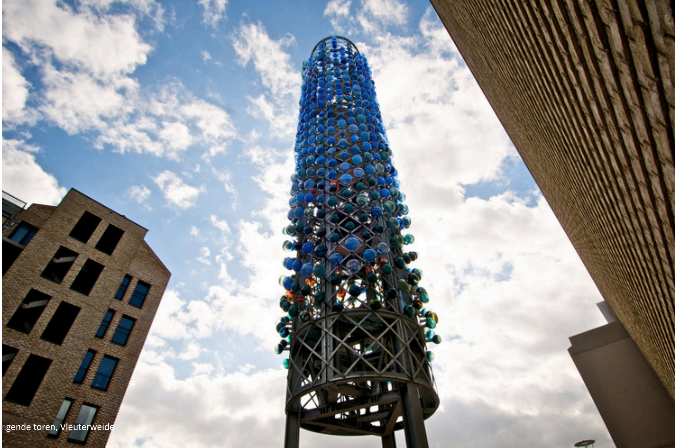
Zingende toren, Vleuterweide