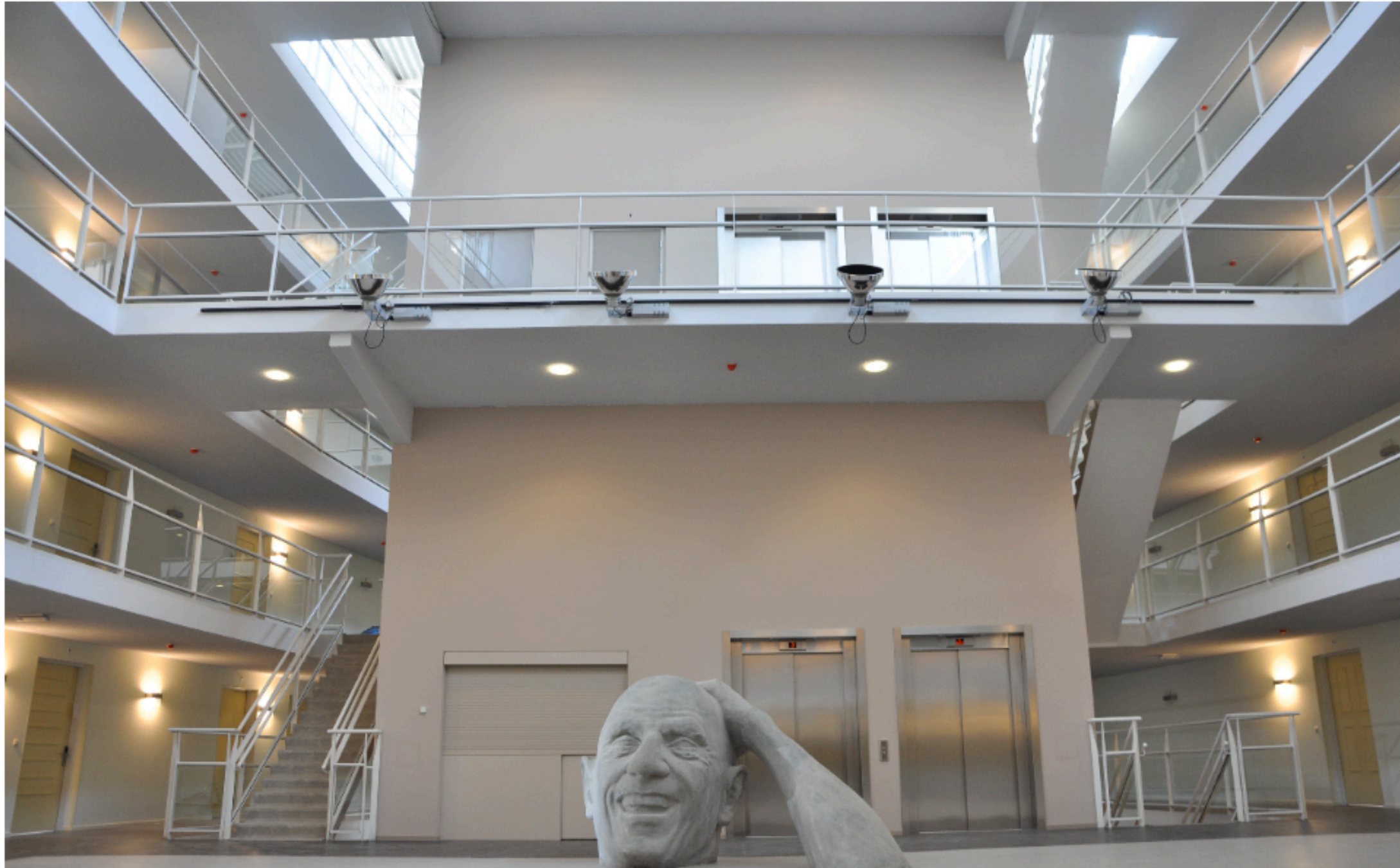
Sculptuur van Hartmut Wilkening, Groningen