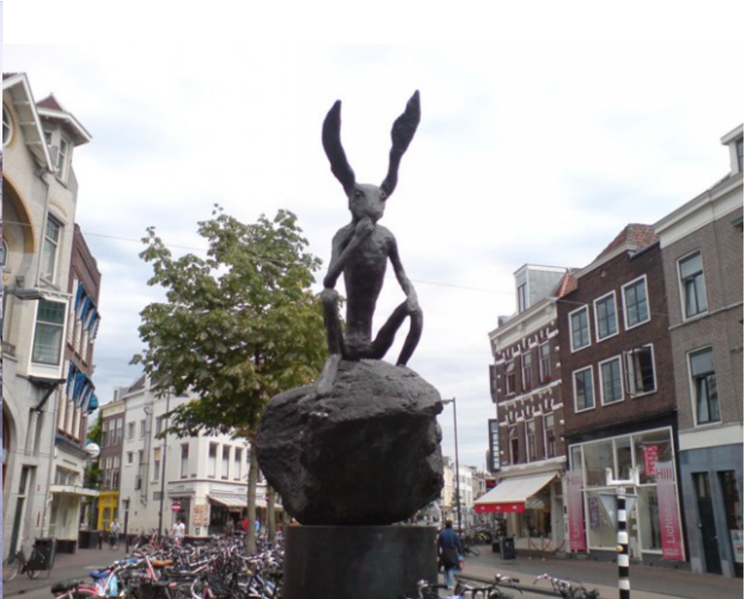
Sculptuur van Barry Flanagan tegenover de Neude