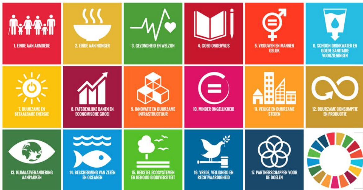
Figuur 1 De 17 SDG's via www.sdgnerland.nl

De toepassing van de SDG's in gemeenteland is vooruitstrevend. Hilversum kan zo mee voorop lopen. Het bevat, naast dat het begrijpelijk is, ook het goede abstractieniveau voor de Omgevingsvisie. Hoe het nastreven van een bepaald doel precies uitwerkt, is niet per definitie onderdeel van de visie. De SDGs zijn verweven met elkaar – inzet op de ene SDG kan andere SDGs zowel positief als negatief beïnvloeden. De kern-SDGs als langetermijnvisie en de kennis over hun relaties met de andere SDGs resulteren in een afwegingskader voor de gemeenteraad. Keuzes die worden gemaakt kunnen afgewogen worden op basis van de bijdrage die het levert aan het behalen van de langetermijnvisie. Daarmee is het een uitstekend middel om op het niveau van de Omgevingsvisie de richting te beschrijven. En omdat het CBS de ontwikkeling van de SDG's in Nederland elk jaar meet, is de voortgang in Hilversum vervolgens objectief en SMART te volgen.