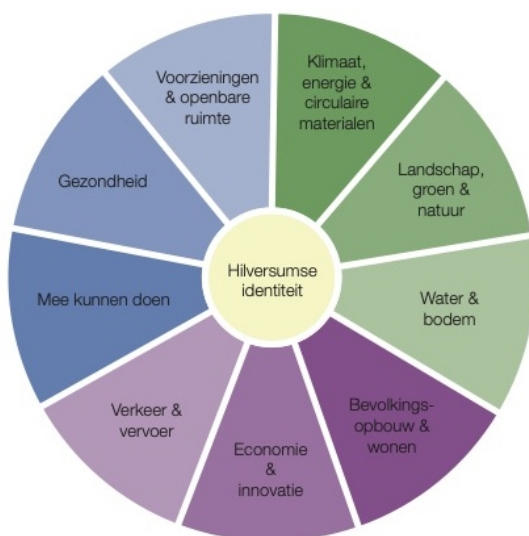
Afbeelding 1: Ondergrond voor het op te stellen afwegingskader