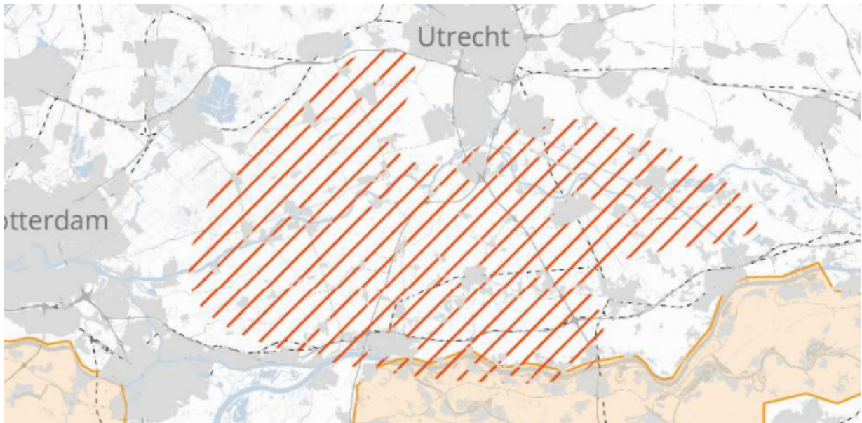
Figuur 1: ligging te onderzoeken nieuw laagvlieggebied omgeving Krimpenerwaard