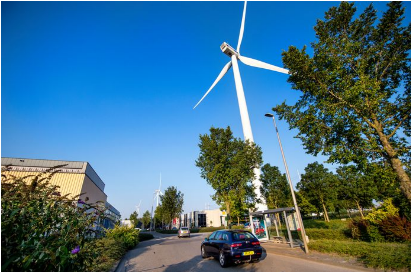
Een van de windmolens Zoetermeer(L-R) Windmolens op bedrijventerrein Lansinghage in Zoetermeer

Provinciale Staten stemmen woensdag over het voorstel van het provinciebestuur om voorlopig niks te veranderen aan de mogelijkheden op Bleizo.