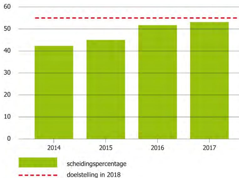
figuur 5-1 gerealiseerde scheidingspercentage en doelstelling in 2018

Figuur 5-1 laat zien dat de stijging van het scheidingspercentage tussen 2015 en 2016 het grootst was. Dit is mede te verklaren doordat de gemeente in 2015 en 2016 startte met het huis-aan-huis inzamelen van kunststof. Tevens werd vanaf 2015 papier in minicontainers ingezameld.