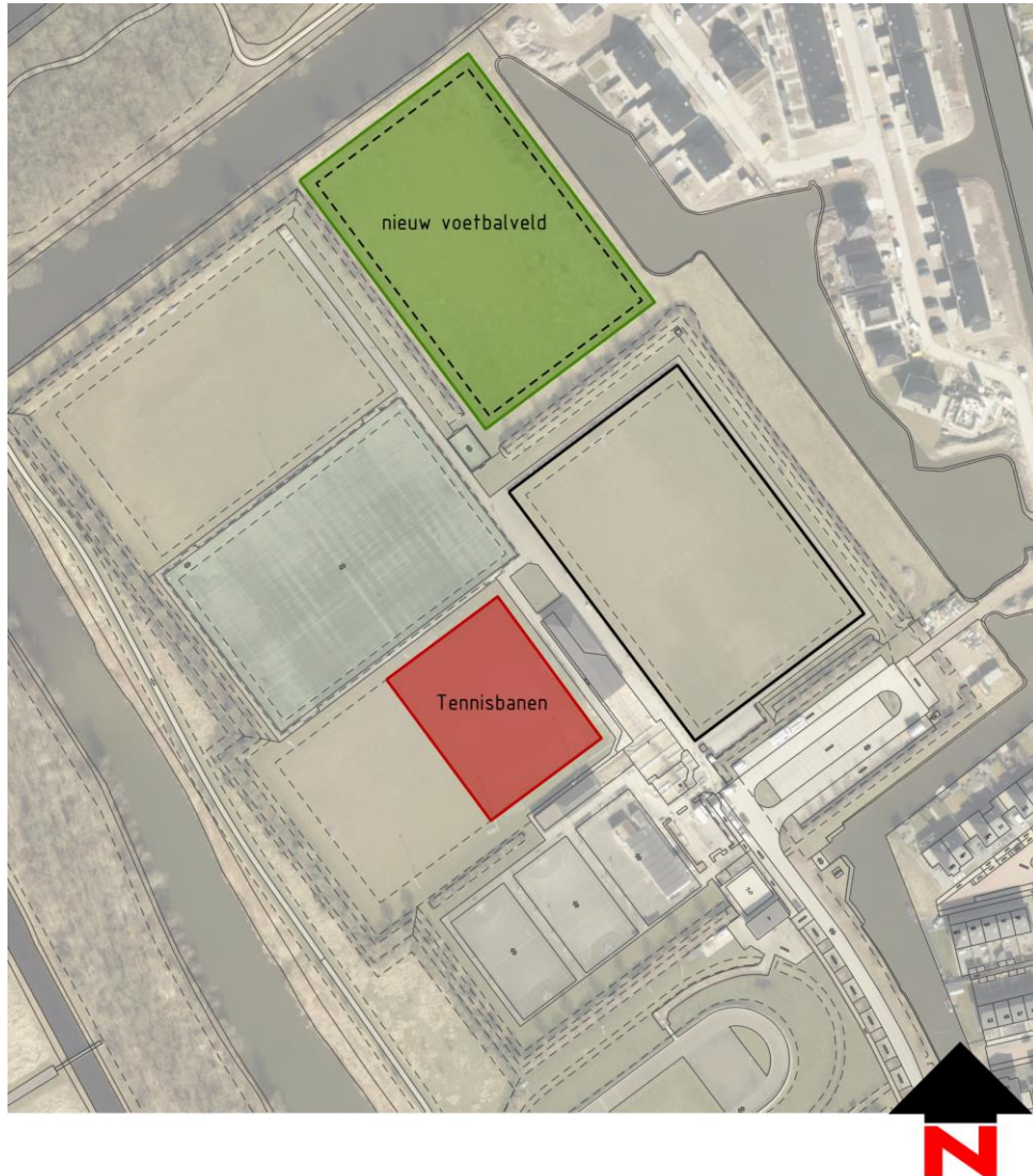
Afbeelding 2: Situatietekening bij verplaatsing tennispark naar De Westrand

Voetbalvereniging V.V.W. stelt het huidige trainingsveld beschikbaar voor de realisatie van het tennispark. In ruil daarvoor wordt een nieuw trainingsveld aangelegd achter het A-veld: