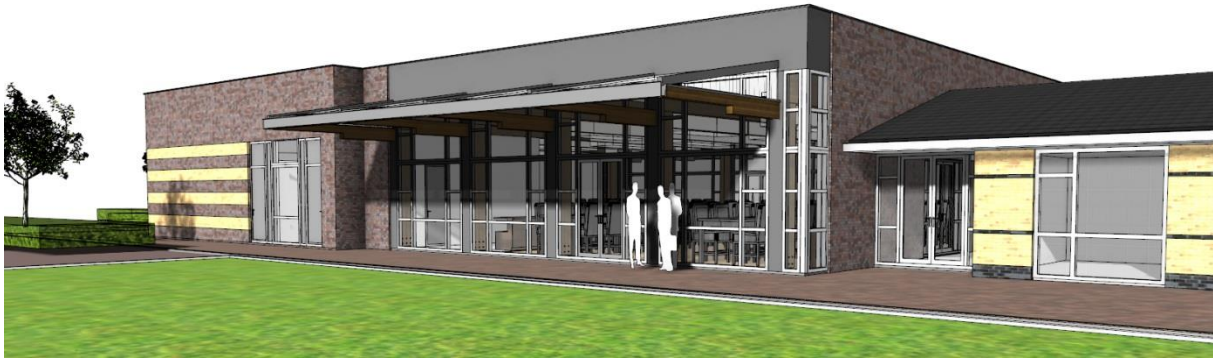
Afbeelding 3: Een glazen pui in de sportkantine met uitzicht op de tennisvelden