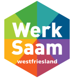
Prognose Additionele werkplekken Beschut Werk