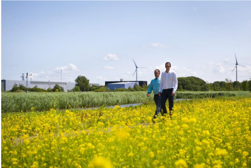
Fotostudio Wick Natzijsl. Het groene en duurzame karakter van bedrijventerrein Boekelermeer.