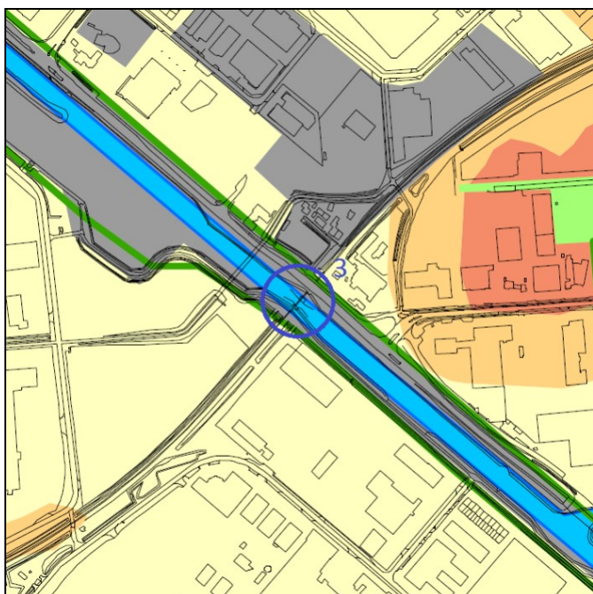
Afb. 6 : KW 3 brug over de Zuid-Willemsvaart.

De brug en de mogelijke kunstwerken hier ter plaatse vormen geen onderdeel van het voorontwerp; zie afbeelding 6.