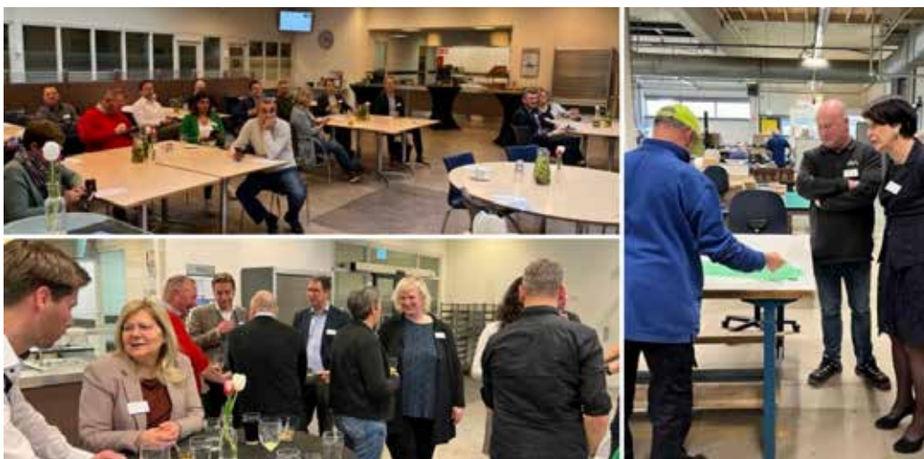
Infobijeenkomst in de gemeente Land van Cuijk