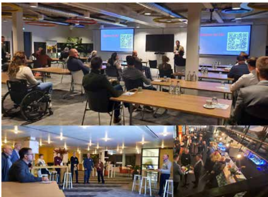
Infobijeenkomst in de gemeente Maashorst

In mei en juni zijn er vergelijkbare bijeenkomsten voor de overige vier gemeenten in het IBN-werkgebied: op 18 mei voor de gemeente Oss en op 17 juni voor de gemeenten Meierijstad, Bernheze en Boekel. Uitnodigingen hiervoor worden in april verstuurd.