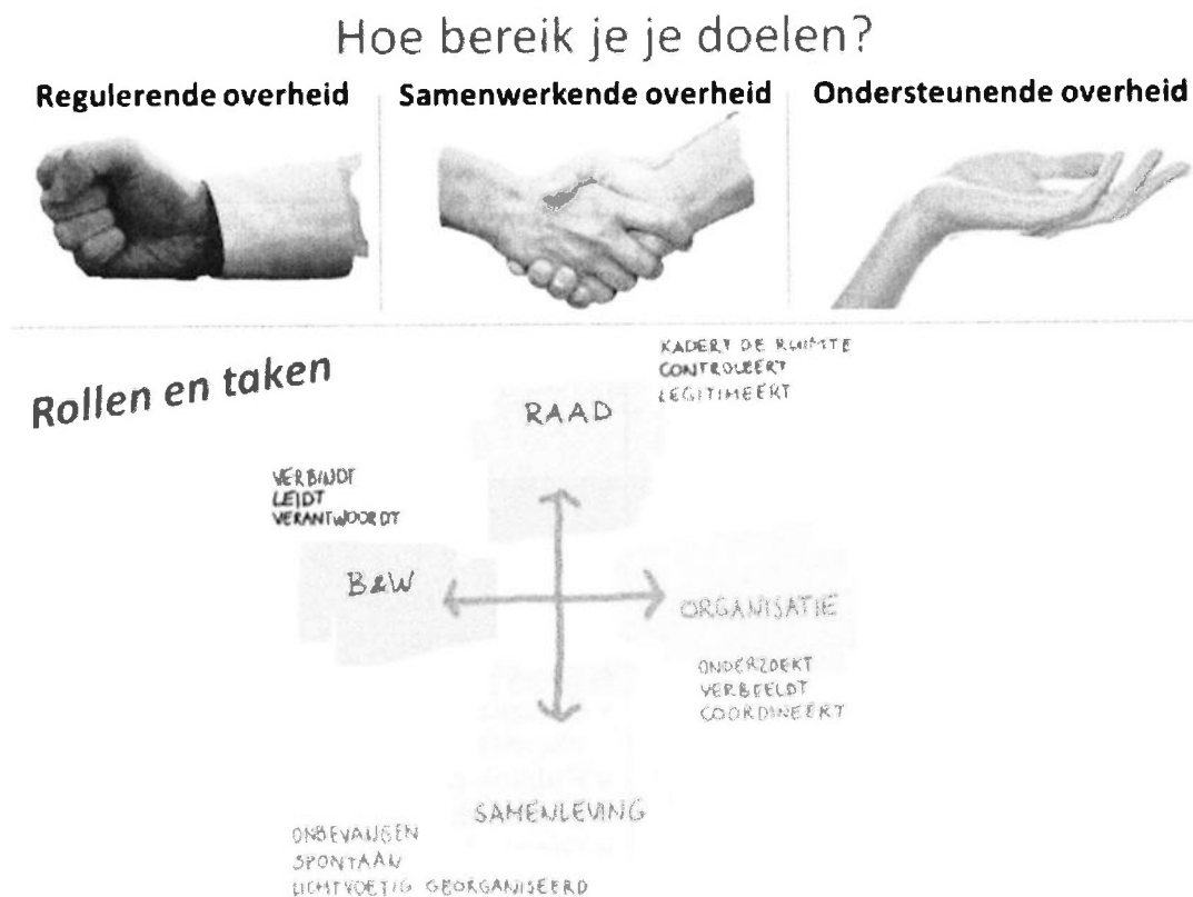
Afbeelding 3: drie rollen en taken van de overheid

Afbeelding 3 geeft een indruk welke rollen wij als gemeentelijke overheid onder de Omgevingswet kunnen spelen. Onze verantwoordelijkheid voor het milieu en de gezondheidszorg vergt van ons een regulerende overheid. Het stimuleren van burgerinitiatieven vraagt soms een samenwerkende of ondersteunende overheid. Naarmate wij als gemeentebestuur in de lijn 'Raad \leftrightarrow Samenleving' de nadruk leggen op onze rol als een regulerende overheid moeten wij ons er wel van bewust zijn dat dit meer werk betekent in de lijn 'B&W \leftrightarrow organisatie'. Bij de rol van een ondersteunende overheid neemt deze claim af. De nadruk wordt meer verlegd naar de samenleving met voor de organisatie aandacht voor monitoring en handhaving.