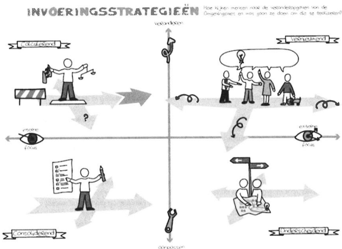
Afbeelding 4: invoeringsstrategieën, bron: VNG

Nu wij aangegeven hebben hoe en waar wij ruimte willen nemen en willen geven (ambitieniveau), kunnen wij bepalen hoe wij de invoering van de vier instrumenten (Omgevingsvisie, Programma, Omgevingsplan en Omgevingsvergunning) in onze organisatie aanpakken en op welke wijze wij dit vorm geven (inzet medewerkers, middelen en instrumenten). Daarbij hebben wij gebruik gemaakt van het door de Vereniging van Nederlandse Gemeenten (VNG) ontwikkelde model, waarin vier mogelijke veranderstrategieën uiteen zijn gezet.