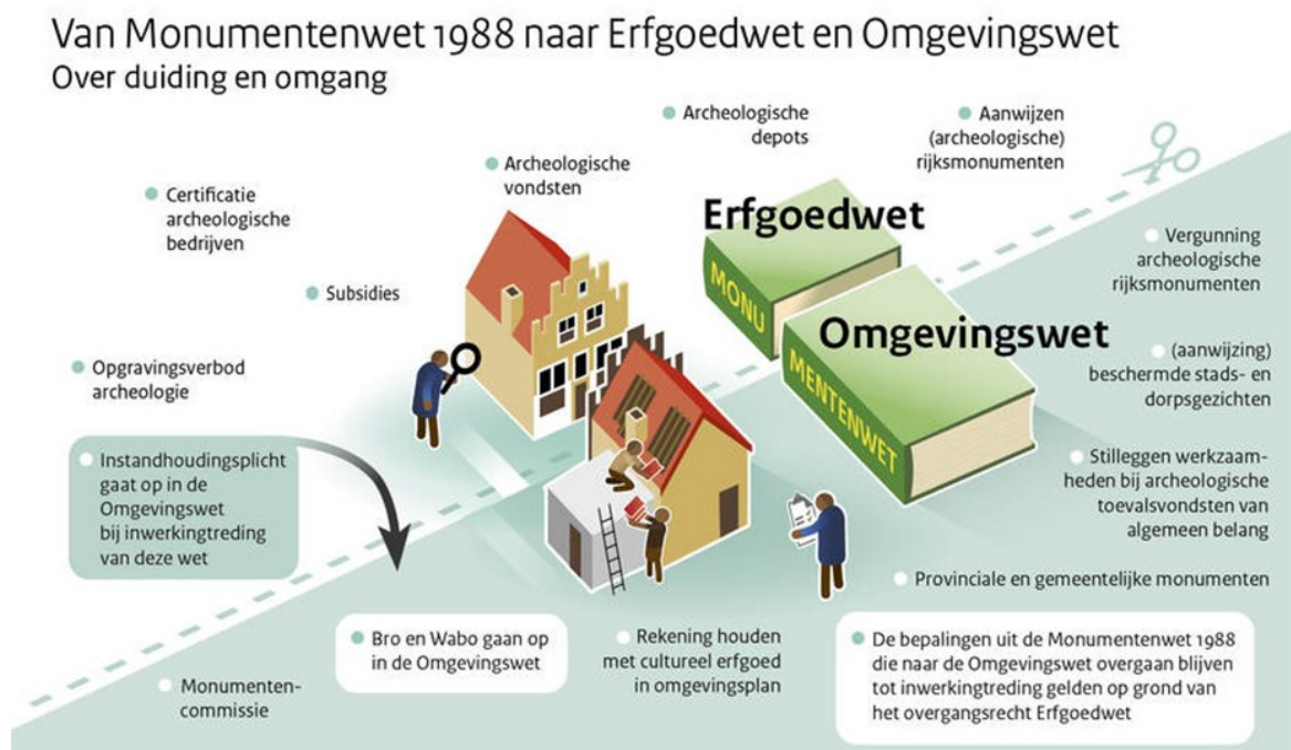
Afbeelding 1: Samen met de Omgevingswet maakt de Erfgoedwet een integrale bescherming van ons cultureel erfgoed mogelijk

De Rijksoverheid heeft de wetgeving aangepast aan deze nieuwe inzichten. De twee belangrijkste wetten op het gebied van erfgoed zijn: de Erfgoedwet (2016) en de Omgevingswet (1 januari 2024). Op het gebied van erfgoed vervangen deze twee wetten de oude Monumentenwet.