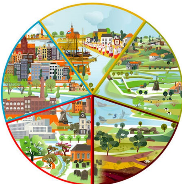
Afbeelding 2: De vijf elementen van cultureel erfgoed als onderdeel van de fysieke leefomgeving.

Met de klok mee: roerend of immaterieel cultureel erfgoed, cultuurlandschappen, archeologische monumenten, Gebouwde monumenten en stads- en dorpsgezichten.