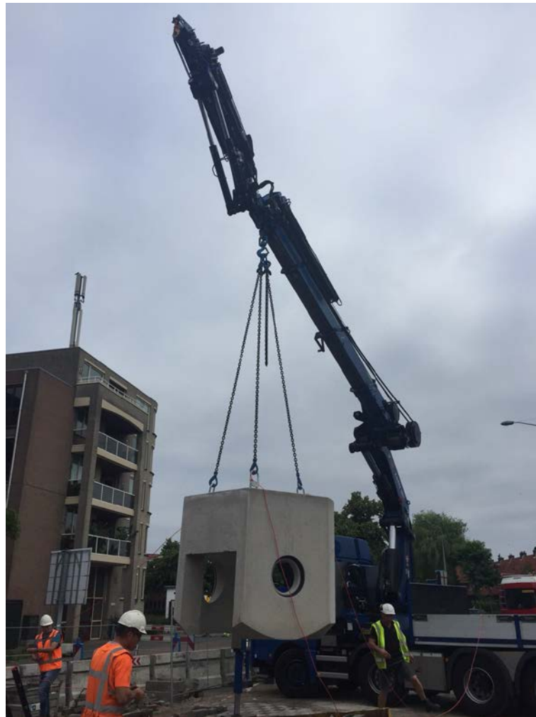
Foto 2: werkzaamheden aan de riolering in de Oosterengweg, Hilversum

Voor de laatste nog benodigde percelen waar nog geen overeenstemming met de eigenaren is, is in het onteigeningsproces de gerechtelijke procedure gestart. De werkzaamheden aan de Oosterengweg in het kader van het verleggen van kabels en leidingen zijn in volle gang. Er hebben zich twee asbestvondsten voorgedaan, die beide inmiddels gesaneerd zijn. De benodigde grondverwerving voor dit deelproject is vrijwel rond. Ter voorbereiding op de realisatie van de contracten 3 en 4 heeft de eerste bijeenkomst van de BLVC-tafel plaatsgevonden. In dit overleg praten project, gemeente, aannemer en nood- en hulpdiensten met elkaar over de aspecten bereikbaarheid, leefbaarheid, veiligheid en communicatie. In Anna's Hoeve heeft Rijkswaterstaat de eerste werkzaamheden voor de op- en afrit uitgevoerd. Daarnaast zijn er ecologische maatregelen getroffen om invulling te geven aan de benodigde compenserende maatregelen voor flora en fauna. Dit betreft onder andere het plaatsen van een amfibieënscherm.