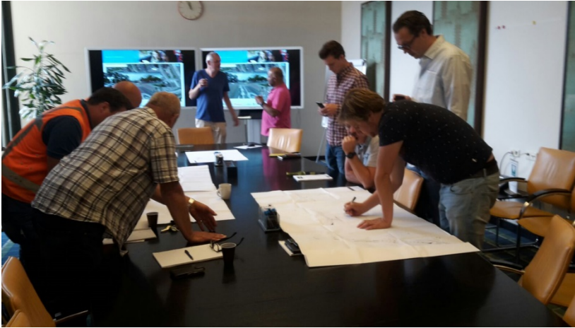
Foto 3: bijeenkomst over veiligheid met team uitvoeringscontract 9 Laren-Hilversum

Op 14 juni heeft de eerste Safety Walk plaatsgevonden over het werk aan kabels en leidingen en riolering in de Oosterengweg. Op 25 juni jl. is een veiligheidssessie gehouden met medewerkers van de gemeente Hilversum, die betrokken zijn bij de voorbereiding en uitvoering van de werkzaamheden voor contract 9, de fysieke bereikbaarheidsmaatregelen die in Hilversum uitgevoerd worden voordat de Oosterengweg afgesloten wordt voor de bouw van de onderdoorgang ter plaatse.