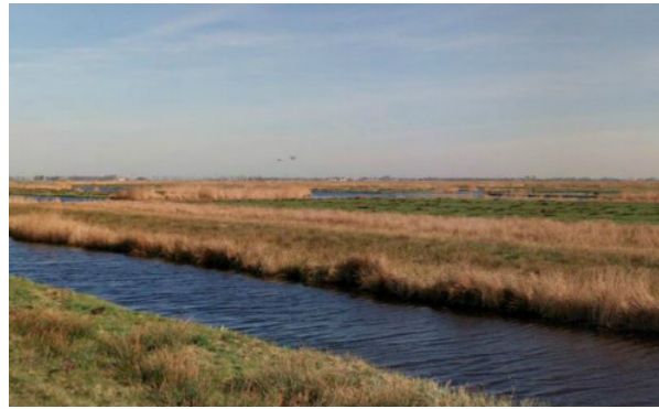
Figuur 2: Impressie fauna uitreedplaats en moerasachtige biotoop