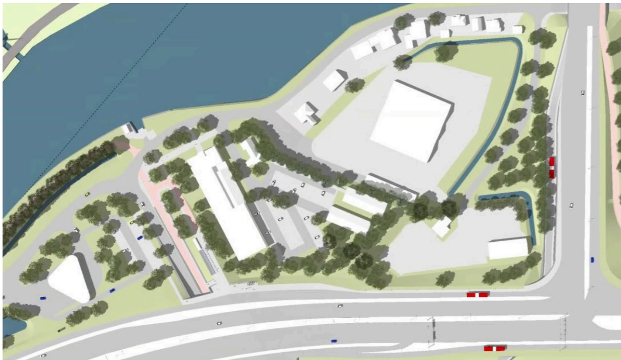
Figuur 6 Impressie eindbeeld N247 waarbij opslagloods IDA is verwijderd.

Door het verdwijnen van dit grote en hoge gebouw valt de barrière tussen de N247 en de woningen aan de Kanaaldijk weg. Hierdoor neemt de geluidbelasting toe op de achtergevels van deze woningen en wordt dit dus niet veroorzaakt door werkzaamheden aan de weg zelf. Aan de voorzijde van de woningen op de kanaaldijk neemt de geluidbelasting echter af en wordt de verkeersveiligheid beter omdat er veel minder vrachtwagen zullen rijden.