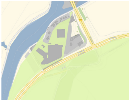
Figuur 4: vigerende kaart van weidevogelleefgebieden

Op de vigerende kaart van weidevogelleefgebieden (figuur 4) staat tevens een fout, waardoor alle open ruimtes binnen het bedrijventerrein Het Schouw is aangegeven als beschermd gebied. Hierdoor lijkt het alsof er relatief veel meters weidevogelleefgebied verdwijnen maar effectief is dit veel minder.