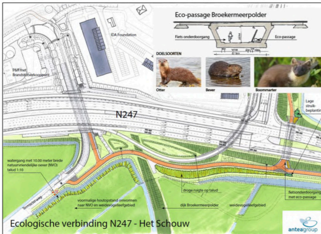
Figuur 3: Ecologische verbinding ter plaatsen van fietsonderdoorgang Het Schouw en de inrichting van de bermen, het voormalig populierenbos en het accentueren van het historische dijklichaam van de Broekermeerpolder

Het ontwerp is daarop aangepast met als resultaat dat voldaan is aan het advies van de gemeente Amsterdam (zie figuur 3).