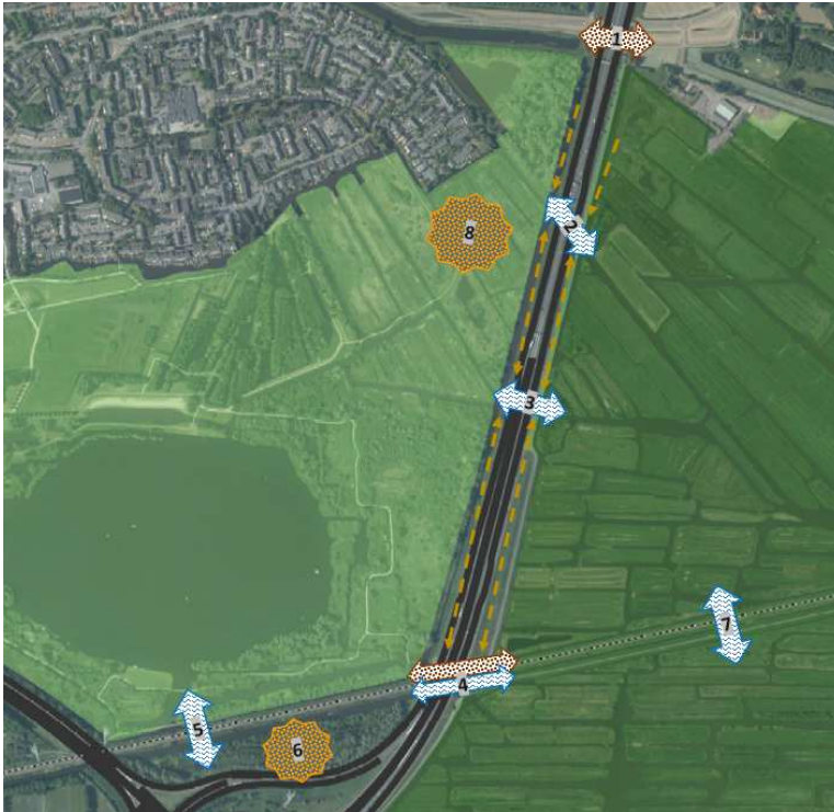
Figuur 2: Voorgestelde bouwstenen zuidelijk deel natuurverbinding Kalverpolder en Oostzanerveld. Nummers corresponderen met de bouwstenen in de maatregelentabel (tabel 2).