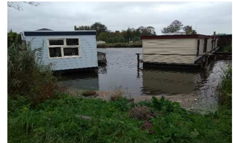
Figuur 4: Foto's huidige situatie. Van linksboven naar rechtsonder locaties 1, 4, 5 en 11.