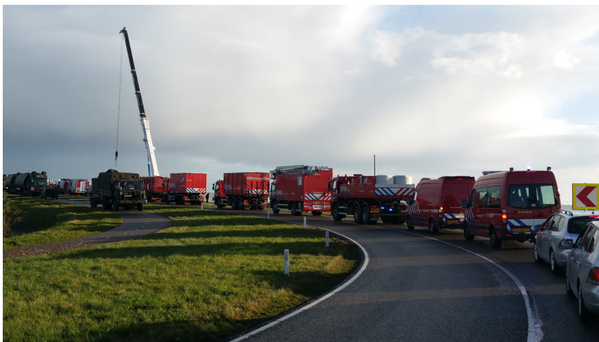
Watercrisisoefening Waterwolf op Marken