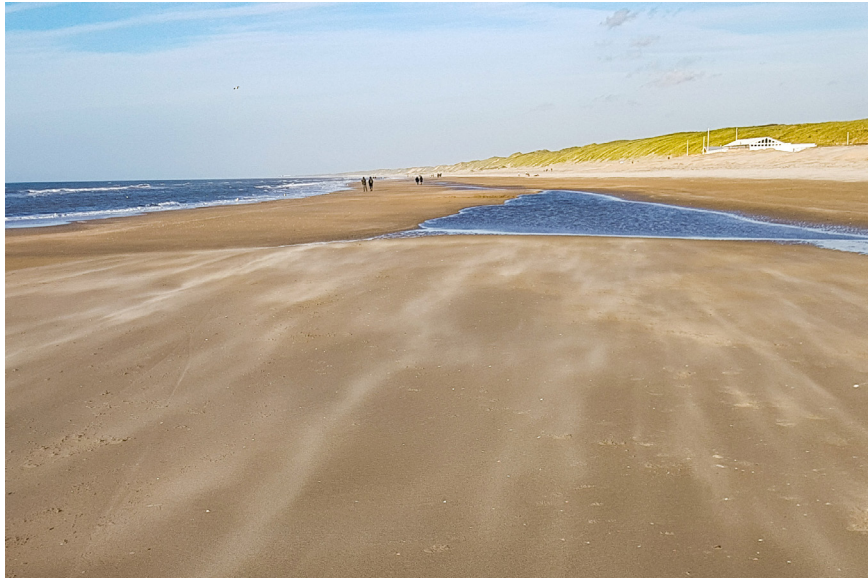
Natuurlijke duinaangroei Noord-Hollandse kust