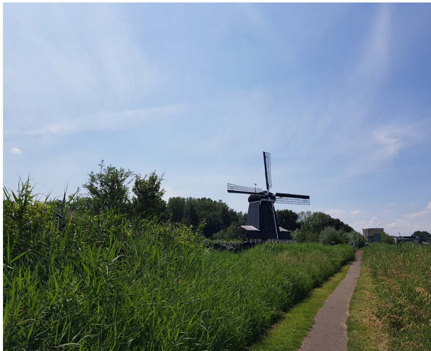
Regionale waterkering met wandelpad langs rivier het Spaarne

De waterkeringbeheerders voeren in afstemming met de provincie verkenningen uit ten aanzien van het wel of niet compartimenteren van gebieden door het aanwijzen van compartimenteringskeringen. Hierbij wordt de compartimenterende werking van wegen, spoorlijnen, en dergelijke onderzocht. Hiermee wordt beoogd dat schade en slachtoffers worden gereduceerd bij een doorbraak van een primaire waterkering. De kaart met de regionale waterkeringen is te raadplegen in de provinciale viewer .