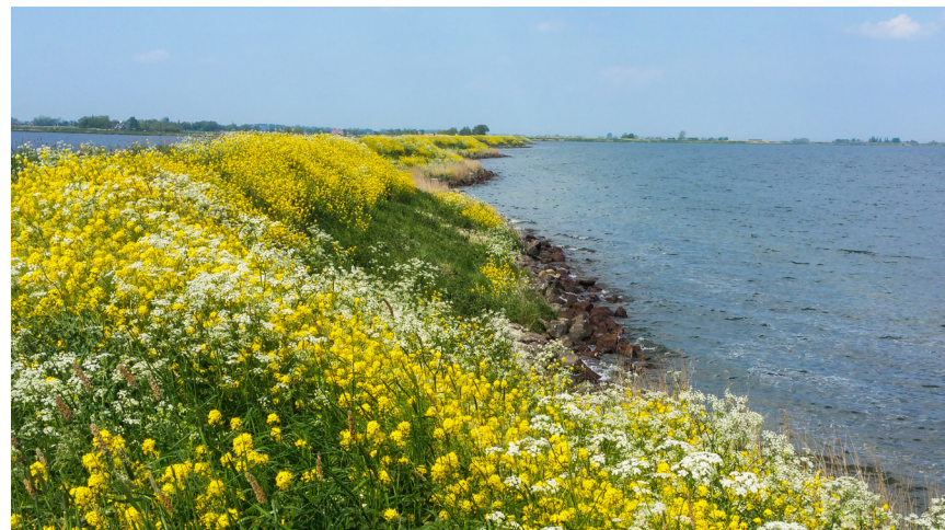
Dijkversterking Waterlandse zeedijk, Markermeerdijk

Ruimtelijke kwaliteit is de landschappelijke waarde en de gebruiks- en toekomstwaarde van een dijk en de zones die eraan grenzen. Wanneer een dijk wordt versterkt is deze weer veilig voor 50 jaar maar ook weer bruikbaar voor medegebruik voor dezelfde periode. Dit medegebruik en het toevoegen van extra ruimtelijke kwaliteit zal