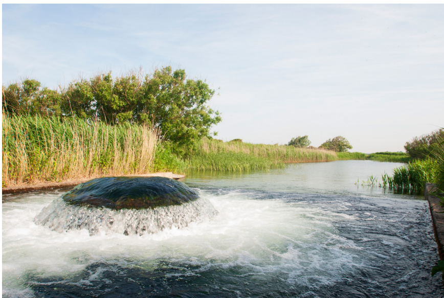
Infiltratie van oppervlaktewater in het Noord-Hollands Duinreservaat

In Noord-Holland wordt drinkwater geleverd door drie bedrijven. Waternet levert water aan Amsterdam en enkele plaatsen in de omgeving, Vitens levert water in een deel van het Gooi, en PWN in de rest van Noord-Holland. De gebieden waar het grondwater wordt gewonnen bevinden zich in het Noordhollands Duinreservaat (51 miljoen m 3 /jaar), de Amsterdamse Waterleidingduinen (70 miljoen m 3 /jaar) en het Gooi (9 miljoen m 3 /jaar, verdeeld over de winplaatsen Huizen, Laarderhoogt, Laren en Loosdrecht). Van het onttrokken water in de duinen is bijna 90% geïnfilterd oppervlaktewater. Dit water is voorgezuiverd en de kwaliteit van het water moet aan het Infiltratiebesluit/BKL voldoen. De infiltratiesystemen zijn, als beschreven in de paragraaf waterbalans, in de vorige eeuw al ontstaan toen bleek dat de grondwateraanvulling door neerslagoverschotten in de duinen onvoldoende was.