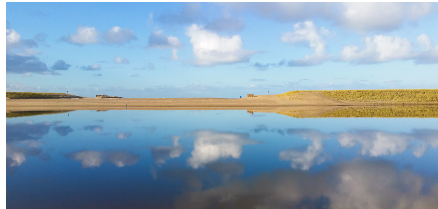
Zeewaartse versterking van de kust bij Camperduin

Noord-Holland is omgeven door water en ligt voor een groot deel onder N.A.P. Bescherming tegen overstromingen is dan ook van groot belang. In haar Omgevingsvisie NH2050 heeft de provincie opgenomen dat de bescherming die de kustverdediging aan het achterland biedt van groot belang is, maar ook dat die benut