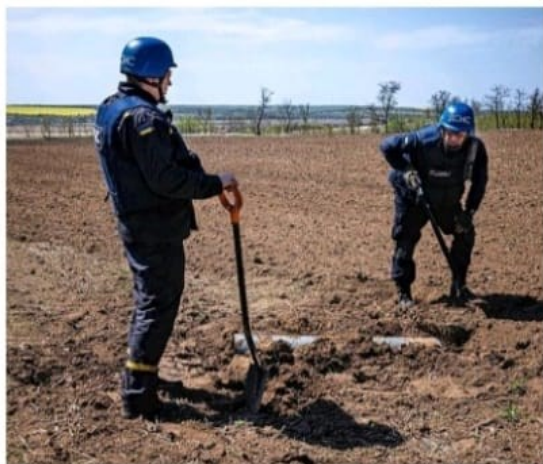
Leden van het mijnopruimingsteam aan het werk.

„ De wereldwijde honger heeft een nieuw hoogtepunt bereikt