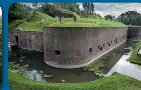
Waterliniemuseum Fort bij Vechten