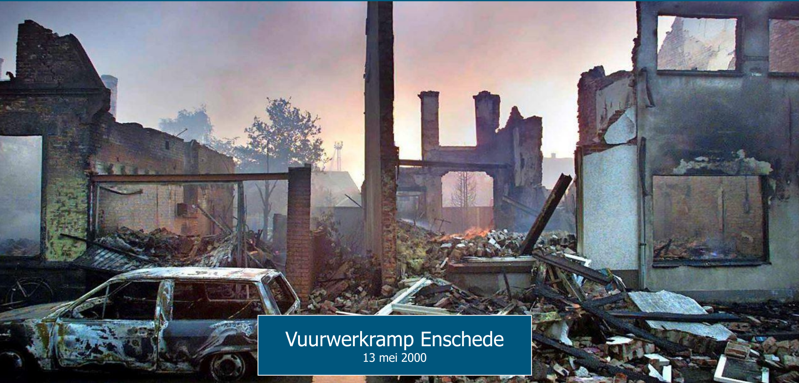
Vuurwerkkramp Enschede 13 mei 2000