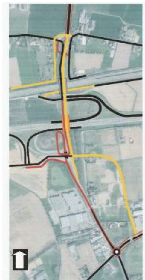
Figuur 46. Voorstel concept-ontwerp kruispunten Knoop 38 Rood: Fietsstructuur Geel/Oranje: Nieuwe auto infrastructuur / viaduct Zwart/Grijs: Bestaande auto infrastructuur / viaduct

De voorziene krullen in de fietsroute (doorstromingbelemmerend!) zijn te voorkomen, wanneer gekozen wordt voor fietsviaducten. Gezien de lange vrije aanrijroute - zowel zuidelijk als noordelijk – is een hellingshoek van 2 - max. 4% gemakkelijk haalbaar (Zie ook CROW publicatie 342, Ontwerpwijzer bruggen langzaam verkeer). Met genoemde invulling is de (verkeers)veiligheid en de doorstroombaarheid (van zowel fietsverkeer als autoverkeer) het beste gediend.