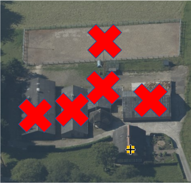
Figuur 1 Luchtfoto Lemelerveldseweg 38, Heino en aangegeven te slopen bebouwing.