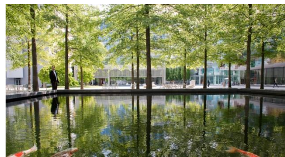
Afbeeldingen: sfeerimpressies campus