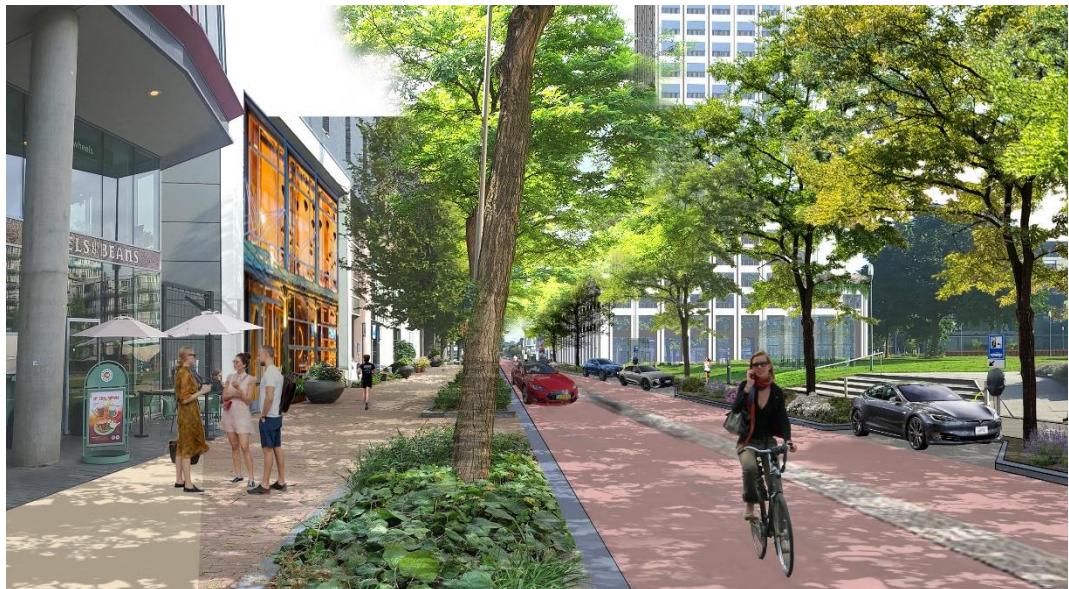
Afbeelding: impressie fietsstraat Kessler Park