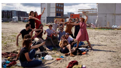
De Warren, Amsterdam (Stefan Hennis)