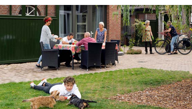
De Lindehoeve, Tilburg