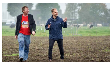
Ecodorp Boekel, Boekel