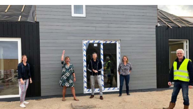
Buurtkap de Tuunen, Texel