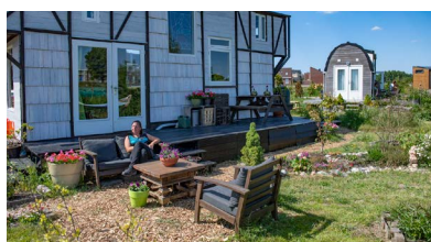
Duinvallei, Katwijk (Bluemonque)