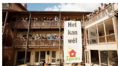
lewan, Nijmegen (Wen Versteeg)