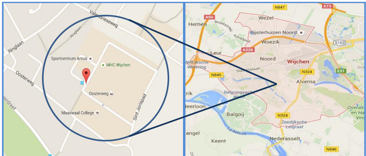
Figuur 1: Kaartuitsnede 'Campus van Wijchen' en positie in de gemeente Wijchen.

De naam 'Campus van Wijchen' staat voor het gebied dat is 'ingeklemd' tussen de Oosterweg, de Ringlaan, de Valendrieseweg en het Sint Jorispad (zie onderstaande figuur). Op dit terrein zijn de afgelopen 10 jaar diverse voorzieningen gerealiseerd. De naam 'Campus van Wijchen' staat voor de verzameling van deze functies. In 2005 (bij de start van de ontwikkeling van dit gebied) waren op dit terrein Hockeyclub MHC Wijchen en de multifunctionele accommodatie 't Mozaïek gevestigd.