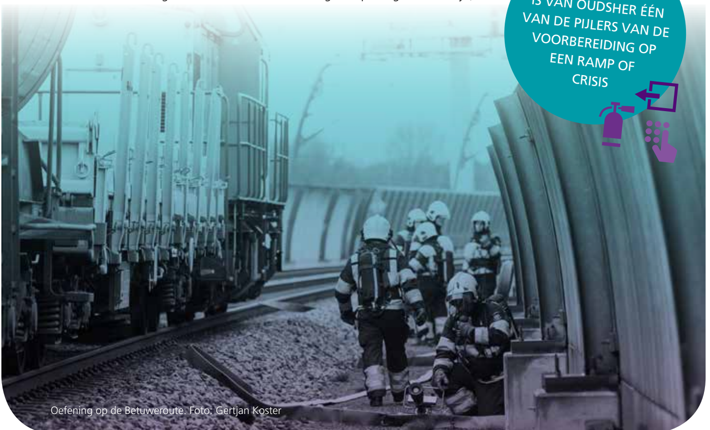
Oefening op de Betuweroute.