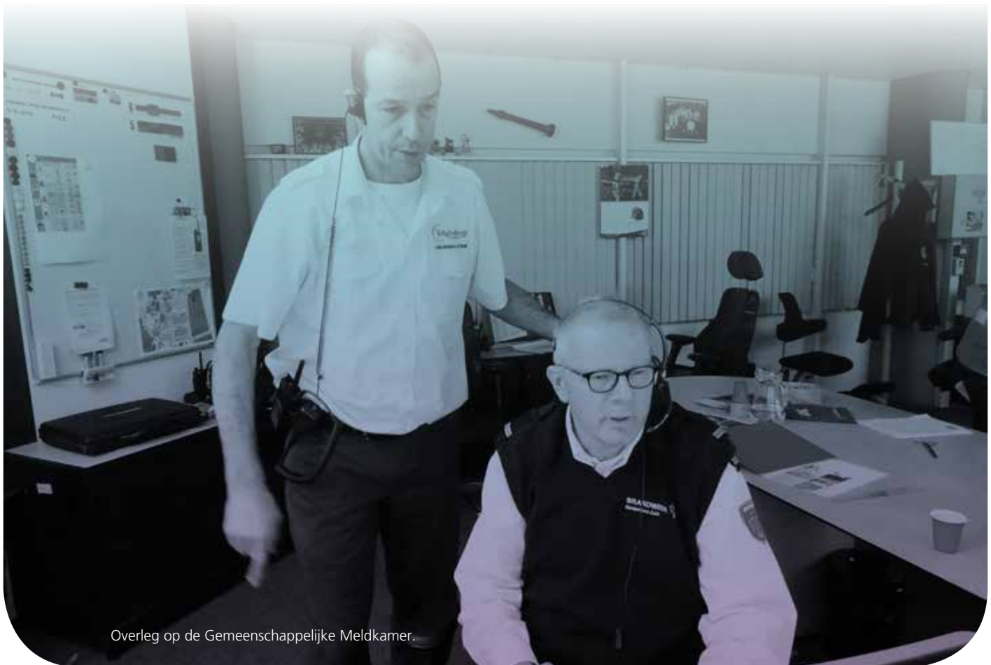
Overleg op de Gemeenschappelijke Meldkamer.

(waaronder ouderen en gehandicapten) een aangepaste aanpak van de hulpverlening tijdens rampen en crises nodig hebben. Voor de hulpdiensten is het noodzakelijk om te weten waar deze mensen wonen. In tegenstelling tot bij zorginstellingen is er geen periodieke inspectie op (brand) veiligheidsaspecten bij 'normale' woningen. Dat is primair een verantwoordelijkheid van eigenaren en gebruikers. Samen met brandweer, politie, gemeenten (bevolkingszorg), RAV, GGD en GHOR wordt voor deze doelgroep een aanpak voor zelfredzaamheid opgesteld.