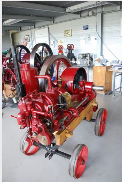
De Hornsby uit 1908