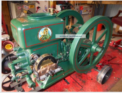
Herculesmotor uit 1917