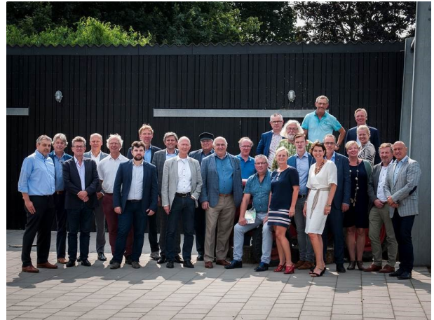
5 september - de deelnemers