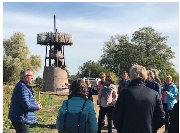
26 september - bezoek aan Weurtse Straatje