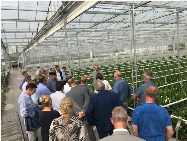
5 september - bezoek NextGarden