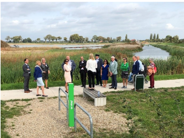
20 september - bezoek aan redoute (Carvium Novem)