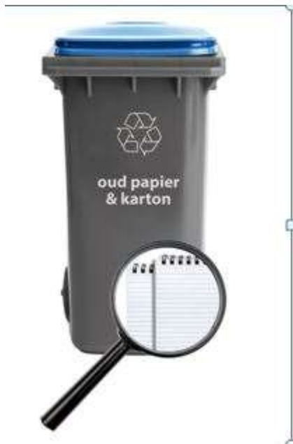
Minicontainers voor oud papier

Er zijn 16.105 containers uitgezet, dat is 245 minder dan vooraf verwacht. De verdeling van 140 en 240 liter containers is nagenoeg gelijk aan de inschattingen vooraf. We hielden rekening met een verhouding van 80% en 20% (240 liter vs. 140 liter). In werkelijkheid heeft 19% van de huishoudens voor een 140 liter container gekozen.