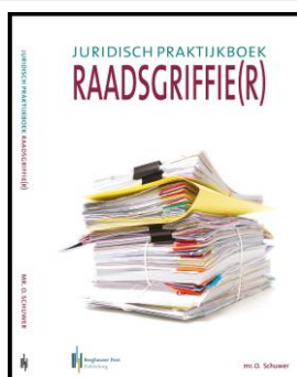
Juridisch praktijkboek raadsgriffie(r)