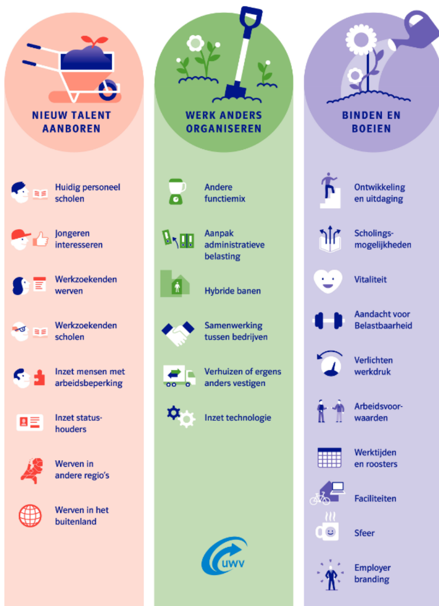
Afbeelding 6 Oplossingen personeelstekorten voor werkgevers

Het verkleinen van de mismatch vereist ook een inspanning van werkgevers. Zij kunnen kijken naar snelle oplossingen, zoals intensiever werven of functie-eisen aanpassen. Een effectieve manier om functie-eisen aan te passen, is door eerst vast te stellen wat de belangrijkste taken van een functie zijn, die bovendien moeilijk zijn aan te leren zijn, en vervolgens dáár op te selecteren. Er zijn ook alternatieve mogelijkheden, die in veel gevallen een grotere inspanning vragen. Afbeelding 6 toont deze oplossingen, onderverdeeld in drie categorieën: nieuw talent aanboren, werk anders organiseren en personeel binden en boeien. Scholing en ontwikkeling staan bij veel van deze oplossingen centraal. Het gaat zowel om opscholing om aan verhoogde functie-eisen te voldoen, bijscholing om vakkennis up to date te houden, als omscholing naar andere functies met een beter toekomstperspectief. Samenwerking tussen werkgevers, UWV, gemeenten, onderwijs of andere partijen in Rijk van Nijmegen is hierbij cruciaal.