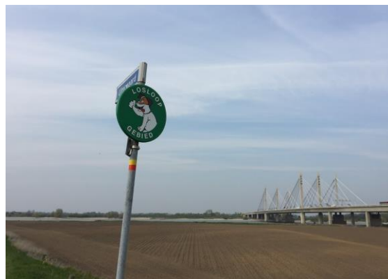
Uiterwaard gemeente Beuningen