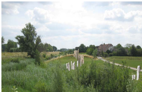
Afbeelding 2: impressie van het kunstproject