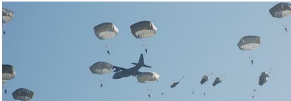
1944-1945 HERDENKEN – BESEFFEN - BELEVEN 2019-2020