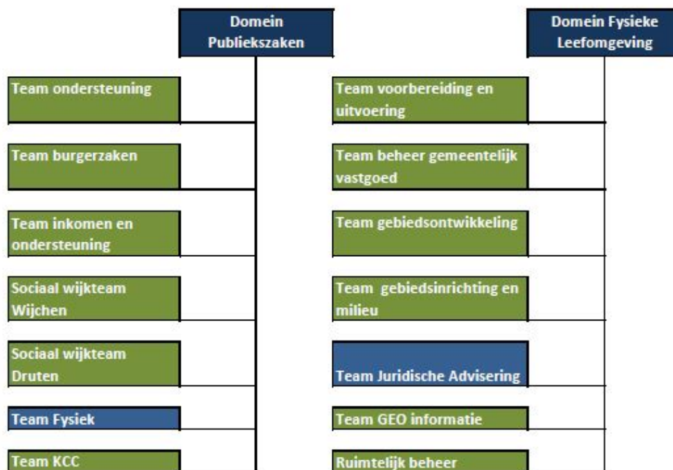
Figuur 1: teams Fysiek en JA-FL binnen organisatiestructuur

Dit uitvoeringsprogramma ziet op de uitvoering van VTH-taken. Deze taken zijn binnen de uitvoeringsorganisatie belegd in twee domeinen: Publiekszaken en Fysieke Leefomgeving en daarbinnen bij de teams “Fysiek” en “Juridische advisering FL” (JA-FL). Het programma is tot stand gekomen volgens de principes van programmatisch en cyclisch werken en sluit daarmee aan op de kwaliteitseisen van de Wet algemene bepalingen omgevingsrecht (Wabo).