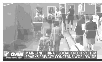
China Behavior Rating System V/S Sweden Microchip implants | Must watch technology

https://www.youtube.com/watch?v=3FMWcLZy3jU