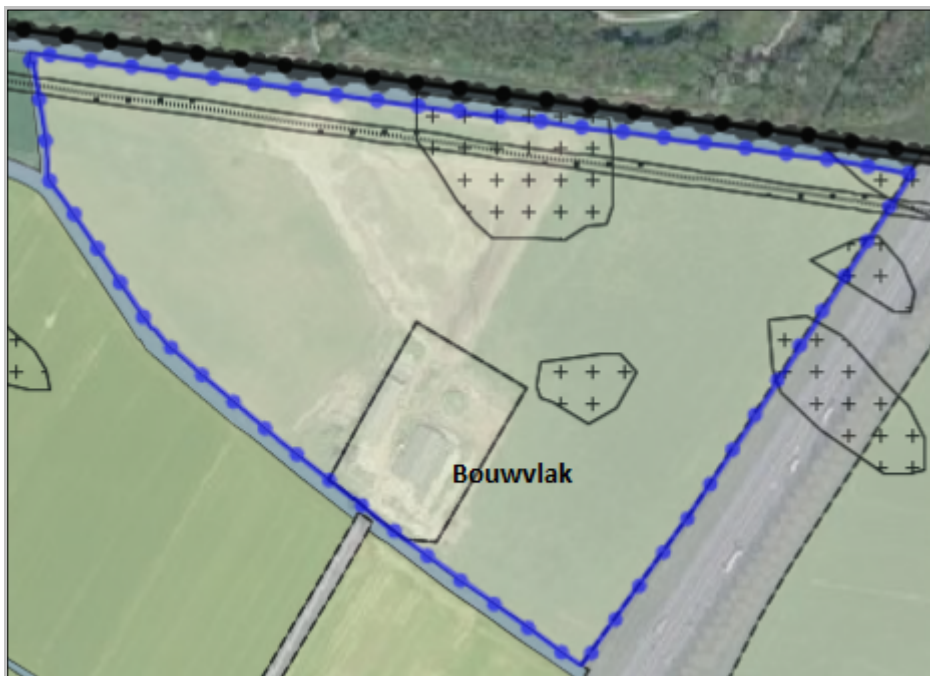
Uitsnede bestemmingsplan Buitengebied

Verder is het van belang om de toekomstige situatie te vergelijken met de huidige planologische situatie. Het perceel waar het zonnepark wordt gerealiseerd heeft een agrarische bestemming: