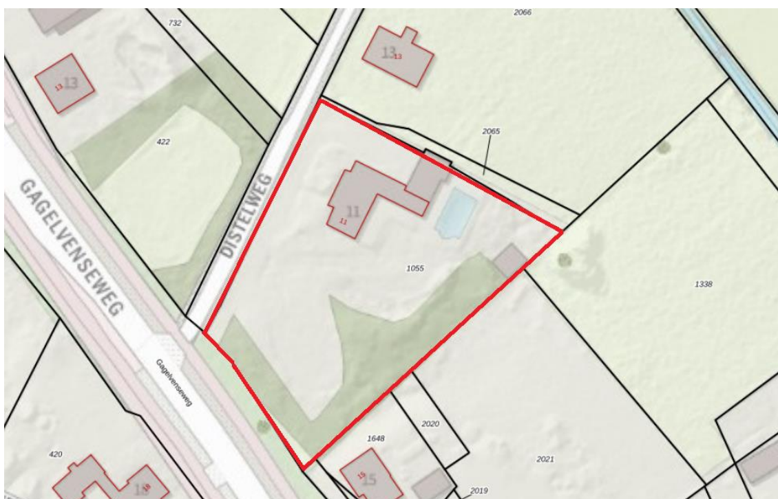
Afbeelding 3: De kavel met kavelnummer 1055 (binnen rood kader) en de direct aangrenzende omgeving, welke bezocht en onderzocht is op de aanwezigheid van beschermde soorten flora en fauna.