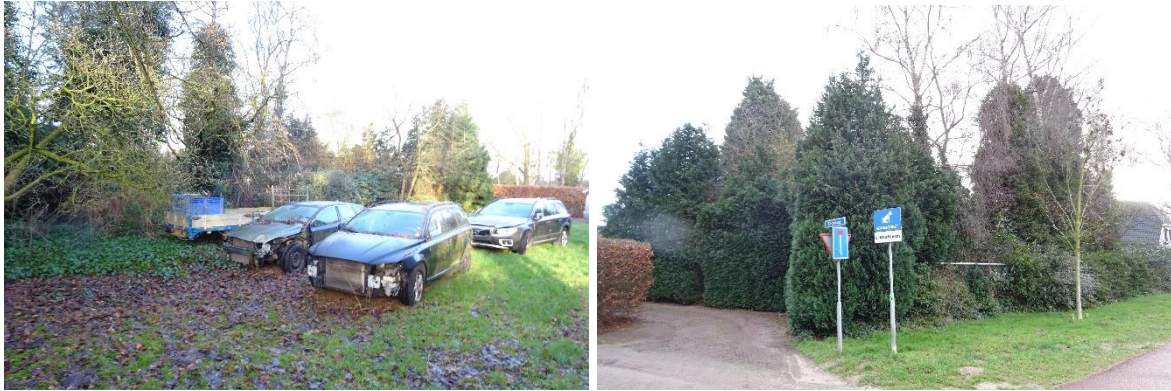
Afbeelding 4 t/m 7: de kavel waarop de ontwikkeling plaat gaat vinden.