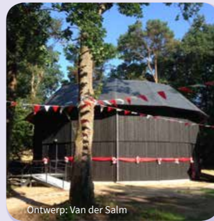
Ontwerp: Van der Salm