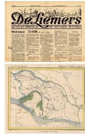
Kranten - Kaarten