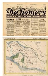
Kranten - Kaarten