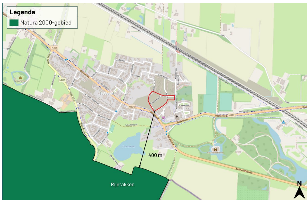
Figuur 3.1 De planlocatie ligt op een afstand van circa 400 m tot het Natura 2000-gebied 'Rijntakken'.

De planlocatie maakt geen deel uit van een Natura 2000-gebied. Op een afstand van circa 400 m ligt het Natura 2000-gebied 'Rijntakken' (figuur 3.1).