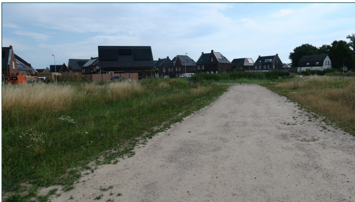
Figuur 1.1 De planlocatie is gelegen aan de Kulturweide ong. te Babberich.