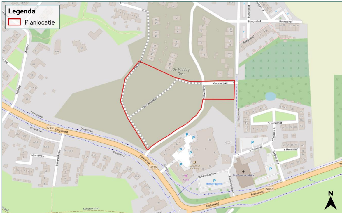
Figuur 1.2 De planlocatie (rood omkaderd) is gelegen aan de Kulturweide ong. te Babberich.

De planlocatie is gelegen aan de Kulturweide ong. te Babberich (figuur 1.2). De planlocatie betreft een braakliggend terrein met enkel lage vegetatie. Een gedeelte is in gebruik als voetbalveld. Er is geen oppervlaktewater aanwezig. In bijlage 1 is een aantal foto's opgenomen die een impressie geven van de planlocatie en de directe omgeving hiervan.