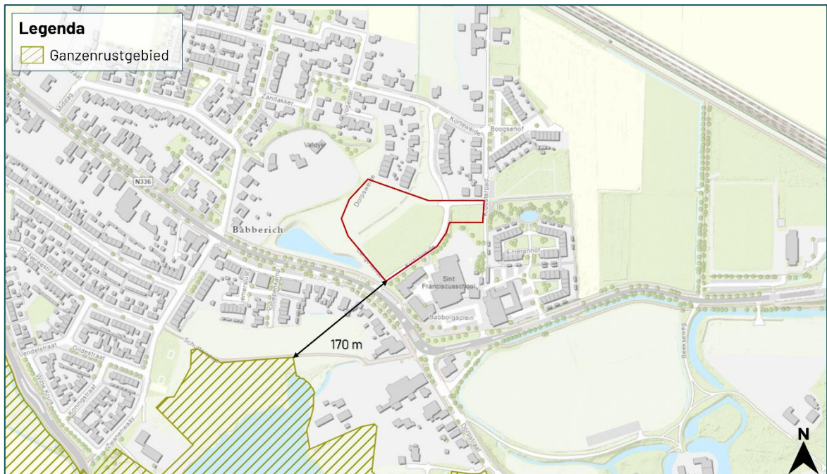
Figuur 3.3 De planlocatie ligt op een afstand van circa 170 m van Ganzenrustgebied. (Bron: gldanders.planoview.nl )