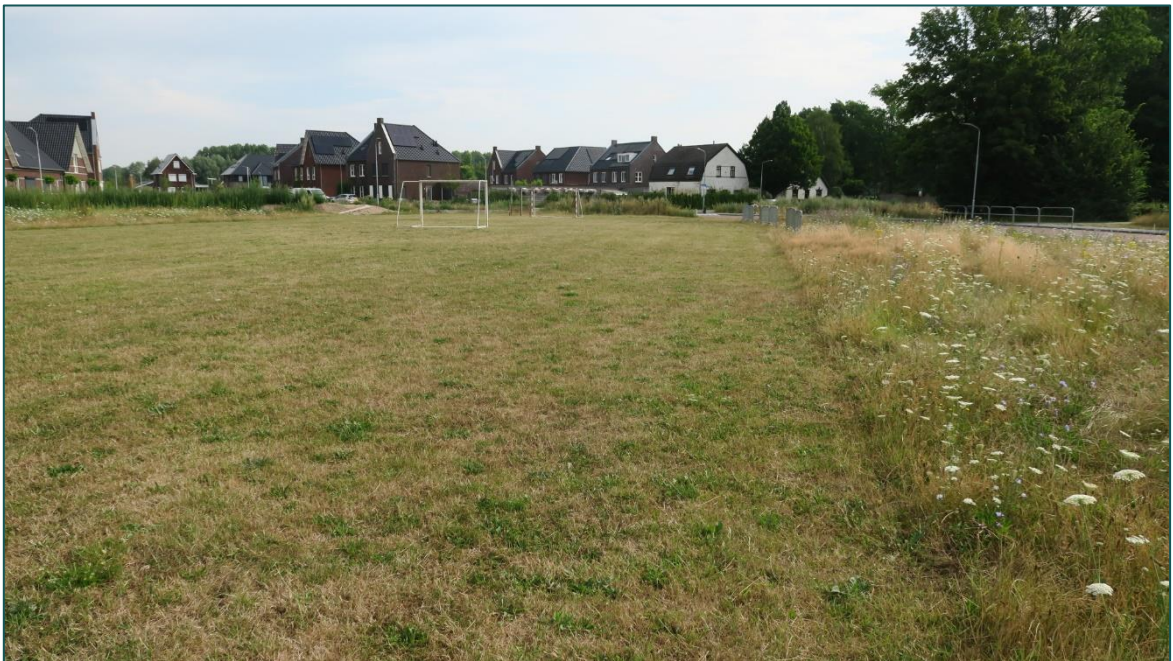
Figuur 4 Een gedeelte van de planlocatie is in gebruik als voetbalveld.