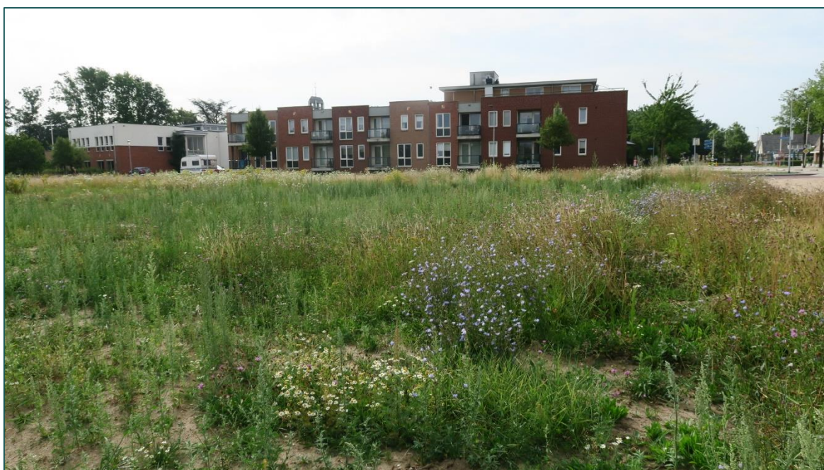
Figuur 2 De omgeving betreft nieuwbouw en infrastructuur.