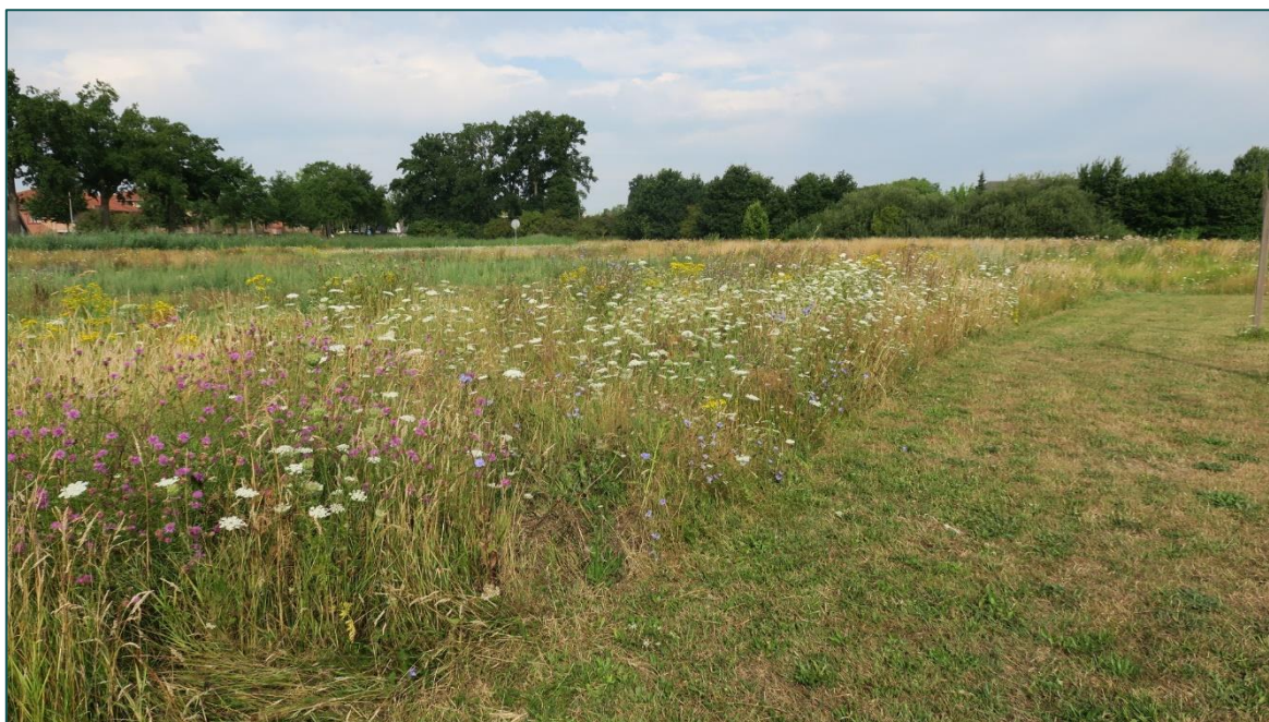
Figuur 1 De planlocatie is gelegen aan de Kulturweide ong. en bestaat uit braakliggend terrein. De beoogde ruimtelijke ingreep betreft de bouw van 44 woningen.