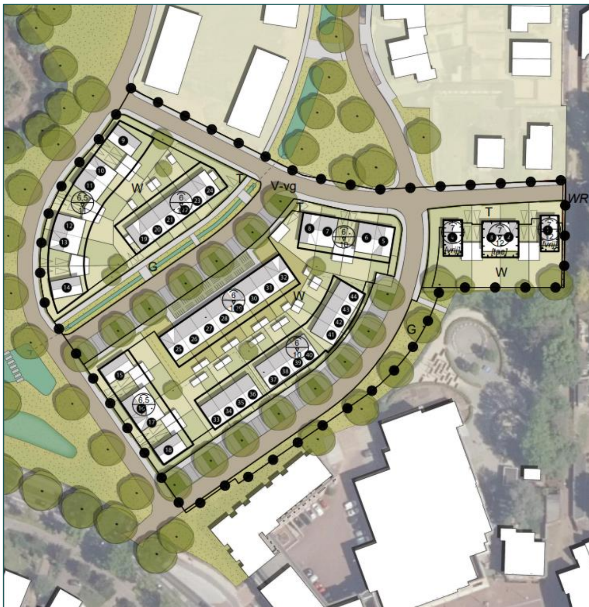
Figuur 1.3 Visuele representatie van de beoogde situatie.