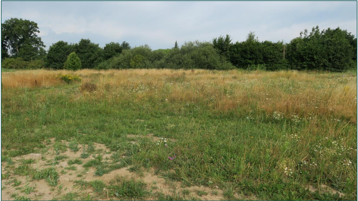
Figuur 3 De groenstructuren op de planlocatie betreffen enkel lage vegetatie.