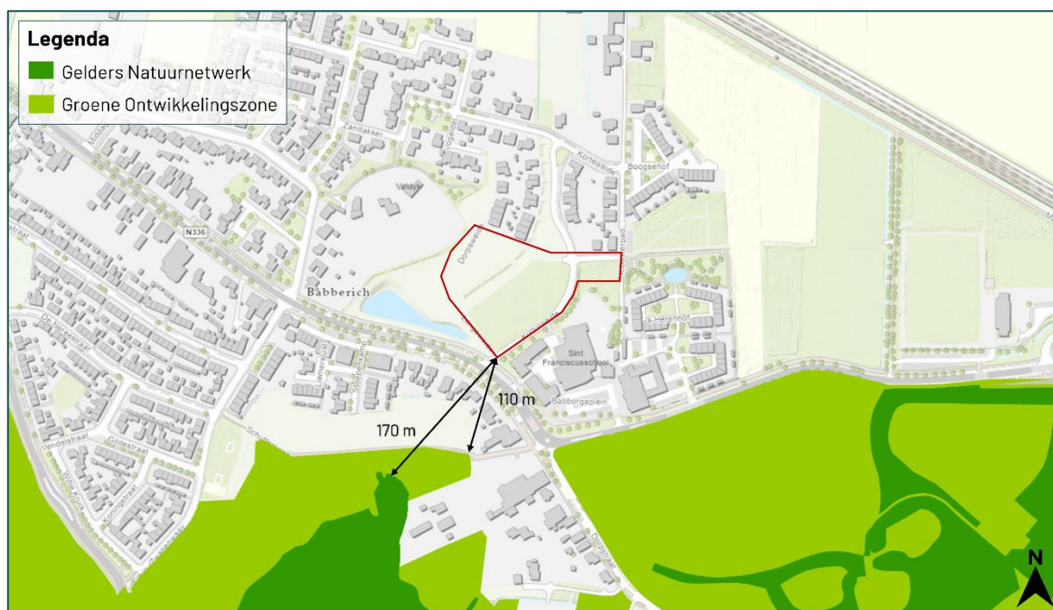
Figuur 3.2 De planlocatie ligt op een afstand van circa 110 m tot het Gelders Natuurnetwerk en circa 170 m tot de Groene Ontwikkelingszone (bron: gldanders.planoview.nl ).

De planlocatie maakt geen deel uit van een beschermd gebied betreffende het Gelders Natuurnetwerk, Groene Ontwikkelingszone, Weidevogelgebied, Ganzenrustgebied of Beschermingszone natte landnatuur. Op een afstand van circa 110 m ligt het Gelders Natuurnetwerk en op een afstand van circa 170 m ligt de Groene Ontwikkelingszone (figuur 3.2). Op een afstand van circa 7,8 km ligt Weidevogelgebied (geen kaartweergave). Een Ganzenrustgebied is gelegen op een afstand van circa 170 m van de planlocatie (figuur 3.3). Op een afstand van circa 14,6 km ligt de Beschermingszone natte landnatuur (geen kaartweergave). Ten aanzien van provinciaal aangewezen gebieden geldt dat externe werking geen toetsingskader is.