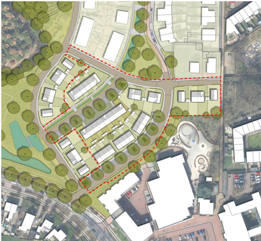
Schetsontwerp met plangebied rood gestippeld