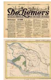
Kranten - Kaarten