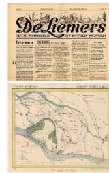
Kranten - Kaarten