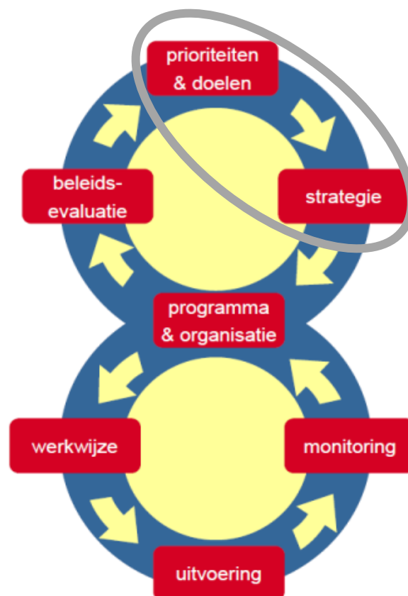
Figuur 1 Big 8

De beleidscyclus bestaat uit de volgende stappen: