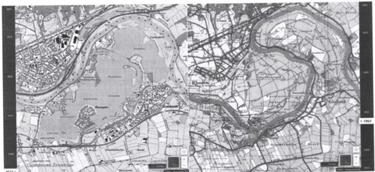
Figuur 1: Rhederlaag op kaart: 2023 (links) en 1963 (rechts).

Ad a. De begrenzingen en de aanduidingen van de verschillende waarden archeologie