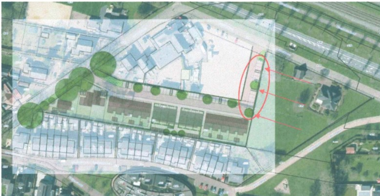
Afbeelding 1. Weergave beoogde plannen in combinatie met huidige situatie op luchtfoto.

Resumerend zijn wij positief over de voorgenomen plannen aan de Grietakkers 7 en zien wij geen zwaarwegende redenen om te ageren tegen onderhavig bestemmingsplan, mits de gewenste planaanpassing inzake de afgesloten erfdienstbaarheid van weg wordt verwerkt. Graag gaan wij in overleg met de initiatiefnemer om voornoemde op een passende wijze te verwerken in de plannen.