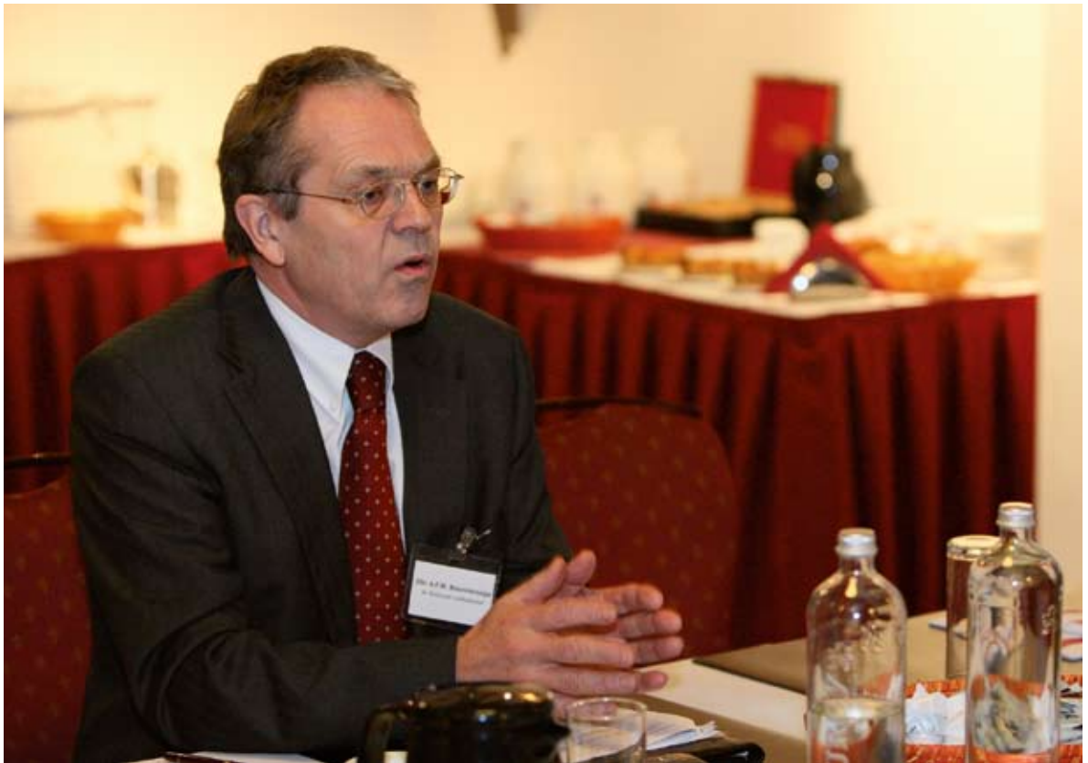
De Nationale Ombudsman, dhr. Benninkmeijer, tijdens een rondetafelgesprek over de code voor goed openbaar bestuur op 27 november 2008 te Utrecht.