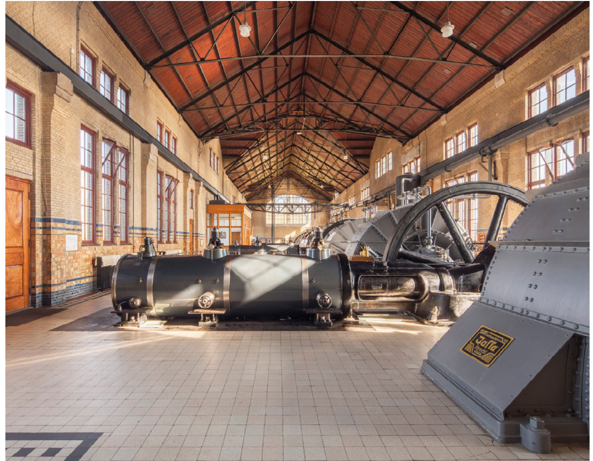
Ir. D.F. Woudagemaal

Het kabinet heeft niet alleen oog voor de waarde van erfgoed, het investeert er ook flink in: de komende jaren is er € 325 miljoen extra beschikbaar. In de brief Cultuur in een open samenleving heeft het kabinet de plannen uit het regeerakkoord uitgewerkt. 1 De nu voorliggende brief gaat specifiek in op het erfgoedbeleid. De nadruk ligt hierbij op instandhouding en herbestemming, de leefomgeving en de verbindende kracht van erfgoed.