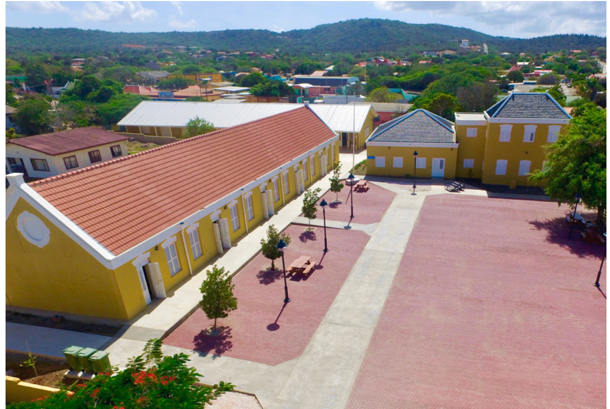
Cocari-complex Bonaire

Tot het erfgoed in Nederland behoren ook gebouwen, monumenten, plekken en objecten die te maken hebben met de joodse cultuur, religie en geschiedenis: van een kleine dorpsjoel of een vergeten begraafplaats tot bekendere plaatsen als het Spinozahuis en het Anne Frank Huis. Joodse begraafplaatsen zijn als rijksmonument beschermd, net als synagogen, de Hollandse Schouwburg en het Anne Frank Huis. Uw Kamer heeft het kabinet verzocht om bijzondere aandacht voor dit erfgoed. 8 Het kabinet erkent het belang van dit erfgoed, ook omdat deze plekken vaak verbonden zijn met een krachtige waarschuwing voor het heden en een boodschap voor de toekomst. Het kabinet ziet er op toe dat in de uitvoering van verschillende regelingen aandacht aan het Joods erfgoed wordt besteed.