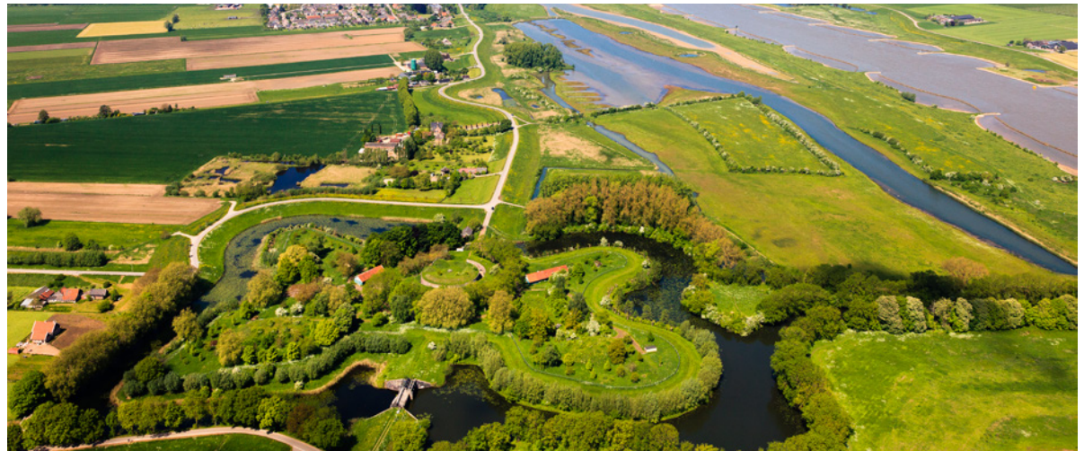
Stelling van Honswijk • foto: Siebe Swart, Rijksdienst voor het Cultureel Erfgoed

Ook de Raad voor Cultuur en de Raad voor leefomgeving en infrastructuur adviseren om meer verbindingen te leggen tussen erfgoed en de veranderingen in onze leefomgeving. Dit vraagt om betrokkenheid van erfgoedorganisaties en om het leggen van verbindingen. Het kabinet heeft hiertoe al een stap gezet door, samen met 26 andere partijen, de Green Deal Participatie van de omgeving bij energieprojecten te ondertekenen. Deze deal heeft als doel inwoners van een gebied en belanghebbenden te betrekken bij onder meer zonne- en windenergie. 10 Opgedane kennis en ervaring uit de Visie Erfgoed en Ruimte over erfgoed, participatie en inpassing worden daarbij actief gedeeld en benut.