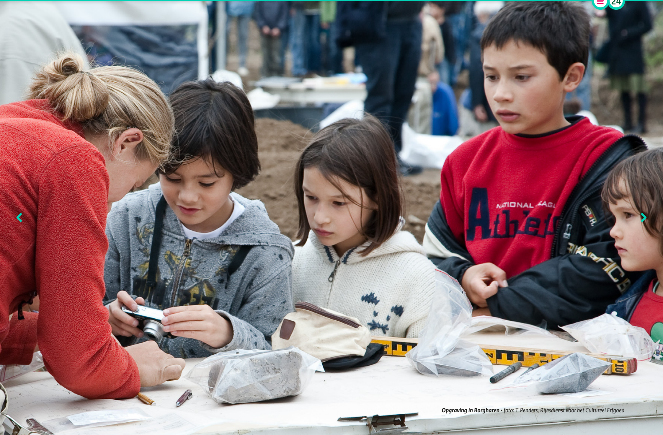
Opraving in Borgharen • foto: T. Penders, Rijksdienst voor het Cultureel Erfgoed